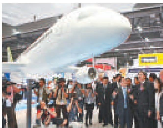
◀ 中商飛公司在亞洲國際航空展覽展C919大飛機1：20體積的模型飛機

目前，中國商飛正全面布局：2008年5月商飛在滬成立後，2009年2月設計研發中心即落戶浦東張江；同年8月，商飛總部入駐陸家嘴商飛大廈，12月商飛總裝製造中心在浦東祝橋奠基；2011年7月，商飛作爲首批入駐上海世博園區（浦東片區）的央企，簽署了開發合作備忘錄。按照計劃，已完成初步設計的中國國產C919大型客機，將在明年完成詳細設計，2014年實現首飛，2016年完成適航取證並投放市場。