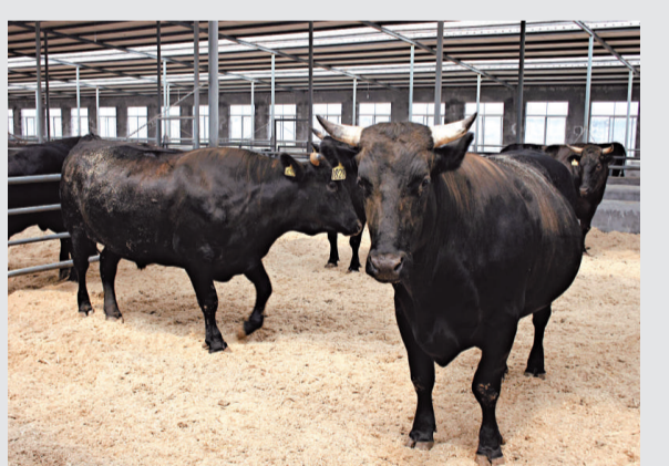
▲山東黑牛的牛肉品質達到了國際A3級標準，可與世界著名的日本「神戶牛」媲美

山東是內地養牛大省，2010年全省肉牛存欄量達726.2萬頭，出欄494.6萬頭，牛肉產量達77.7萬噸，居全國第二位。