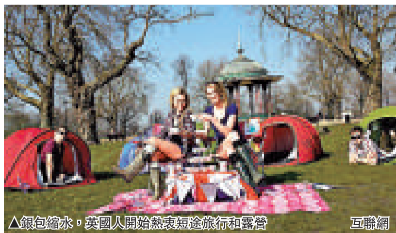
▲ 銀包縮水，英國人開始熱衷短途旅行和露營 互聯網