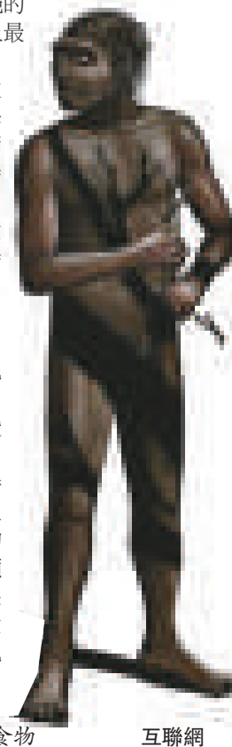
► 直立人可能已經學會烹飪和加工食物 互聯網

研究人員發現，直立人、尼安德特人和智人（二者的進化時間均晚於直立人）進化出了比其他靈長類動物更小的白齒，這種轉變無法通過這些物種的頸和頭的總體進化數量加以解釋，但如果他們用工具和火加工食物，則可以讓食物變軟，因而也就允許更小的白齒出現，進食時間也相應減少。