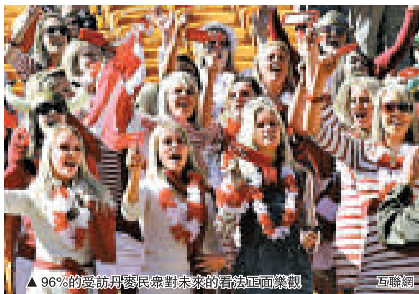
▲ 96%的受訪丹麥民眾對未來的看法正面樂觀 互聯網

健康專家警告說，由於肥胖患者增多，美國每年的醫療開支將額外增加660億美元，英國則每年增加20億美元。目前，全球有15億人體重超重，另有5億人肥胖，1.7億兒童體重超重或太胖。