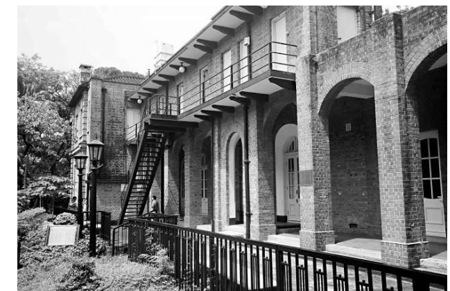
舊理民府是典型的愛德華時期建築

舊理民府大樓是一幢富有英國愛德華時期風格的建築物，紅磚結構，有巨形的圓拱門窗和拱心石。為適應香港的潮濕炎熱天氣，外圍建了寬闊遊廊。從歷史照片可知，大樓原有南北兩座單層建築，中間以草棚分隔，其後連成一體，並在北座加建一層。經歷百載，大樓仍然完好，足見當年建築技術之精湛。