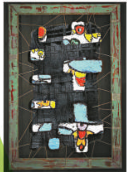
◀「天空之城」將原本毫無生機的垃圾變成了栩栩如生的藝術品