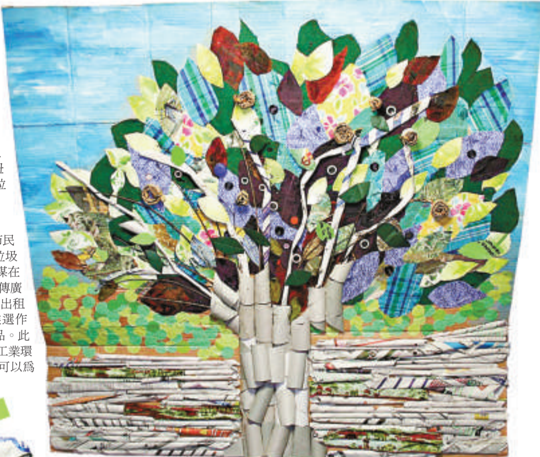
▲來自香港和台灣的參賽者用塑料瓶和廢紙做的作品「樹」