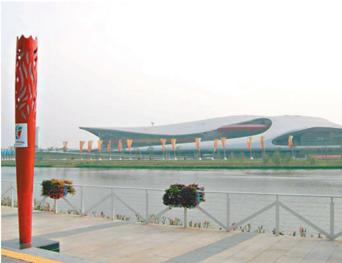
▲在後亞運時代，亞運文化村開發升級，打造成亞洲文化體驗中心。圖為亞運城