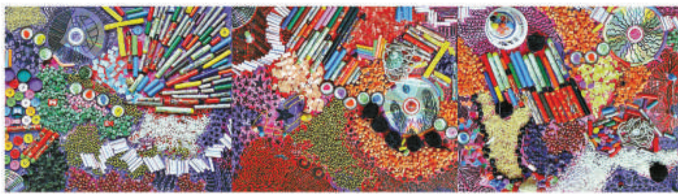
▲作品「愛玩藝術的小男孩」，由光盤製作的小男孩形象在藝術材料中舞蹈

在上海市環境保護局的支持下，為了響應政府對市民提出的在丟棄垃圾之前把垃圾分類的強烈號召，「垃圾分類」成為今年「環保亦酷」活動的主題。觸動傳媒在上海、北京、廣州和深圳的出租車內，運用互動宣傳廣告，僅在十二個星期內覆蓋乘客超過一億。通過出租車內的互動螢幕申請比賽報名表，欣賞冠軍候選作品，並為心儀的作品投票，選出民意的冠軍作品。此外，乘客只需簡單地點擊互動廣告，即可探索工業環保新舉措，玩以環保教育為主題的遊戲，還可以用自己的手機和電腦下載環保壁紙。展覽時間至八月三十一日。