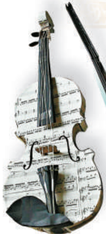
▲用廢紙、塑料管和易拉罐等廢棄材料製成的冠軍作品「環保小提琴」