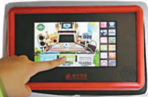
▼乘客在出租車內觸動傳媒的互動螢幕上點擊參與「垃圾分類」環保遊戲