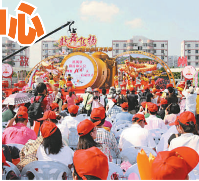
▲番禺區舉辦「鼓舞飛揚」活動

去年初，番禺政府決定在亞運城對面石樓鎮瀾江河以東建設亞運文化村，當時此處仍是一片荒蕪灘塗、舊廠房、舊村落。亞運文化村在整個規劃、設計與建設過程中，貫穿着對舊廠房舊村落升級改造方法的科學探索，成為廣州市三舊改造的示範點、自行車綠道建設的示範點、治水的示範點。原廣船廠噴砂車間破舊的外立面被巧妙改造為文化廣場牌坊，既用最小的代價裝飾了破舊的廠房，又為市民文藝表演活動提供了合適的場地。