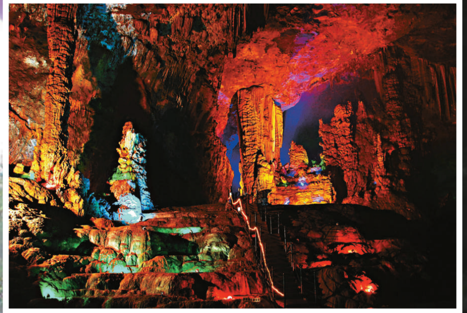
▲黃仙洞內鐘乳石色彩斑斕 ▲黃仙洞口呈圓拱型，洞高15米，寬24米