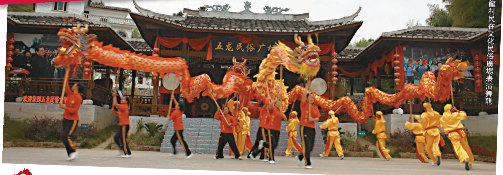
▲五龍村民在文化民俗廣場表演舞龍