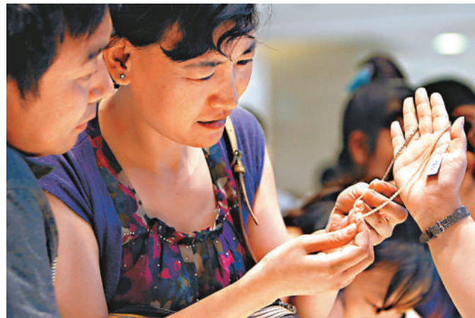
▲兩名消費者在櫃檯前選購黃金飾品

唐慶說記者，目前沒有蘇州民間藏金量的數據統計，但是如果按世界黃金協會的推算法，中國發達地區人均持有黃金量約為6克，那麼照此估算，蘇州民間的藏金量可能已經超過了60噸。