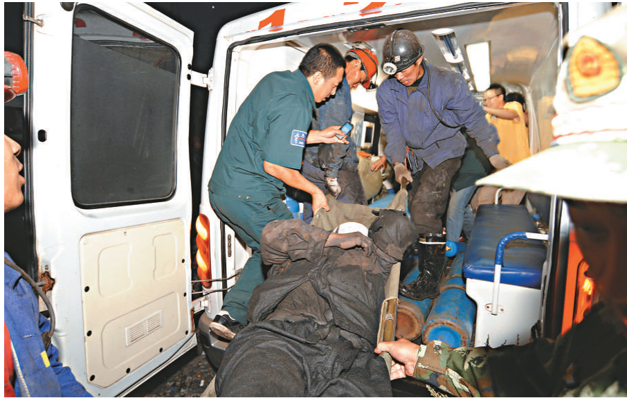
▲一名獲救礦工被抬上救護車

23日，黑龍江省七台河市勃利縣恆太煤礦發生透水事故，當班入井45人，其中19人安全升井，26人被困井下。目前還有22人下落不明，搜救工作仍在緊張進行中。