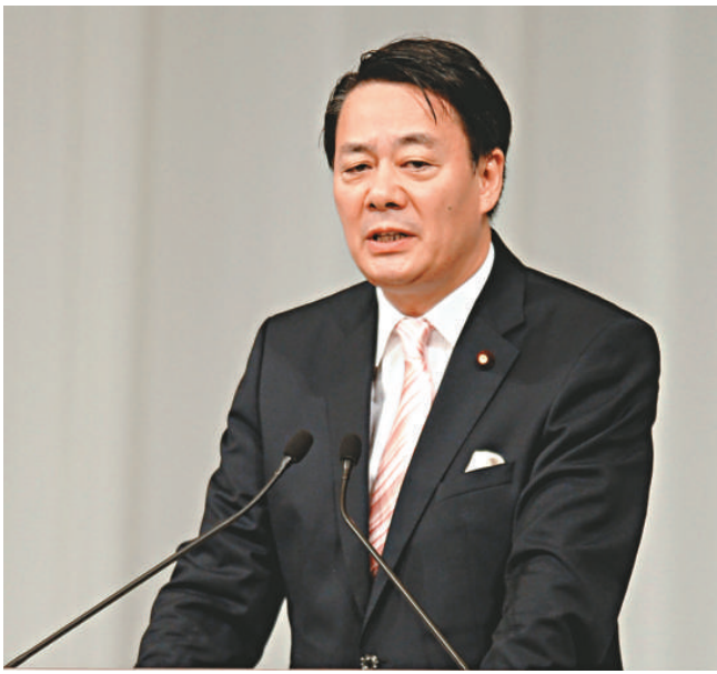
▲經濟產業相海江田萬里28日發表競選演講

民主黨前幹事長小澤一郎率領的「小澤派」約有140人，是最大派系。以前首相鳩山由紀夫為首的「鳩山派」約40人，海江田即屬該派。此外，「前原派」35人，野田佳彥的「野田派」有35人左右，馬淵澄夫不屬於任何派系。目前，小澤和鳩山已決定支持海江田參選。不過，海江田也有劣勢，他與菅直人在重啓核電站問題上產生嚴重分歧時沒有立刻辭職，給人留下缺乏決斷力的印象。