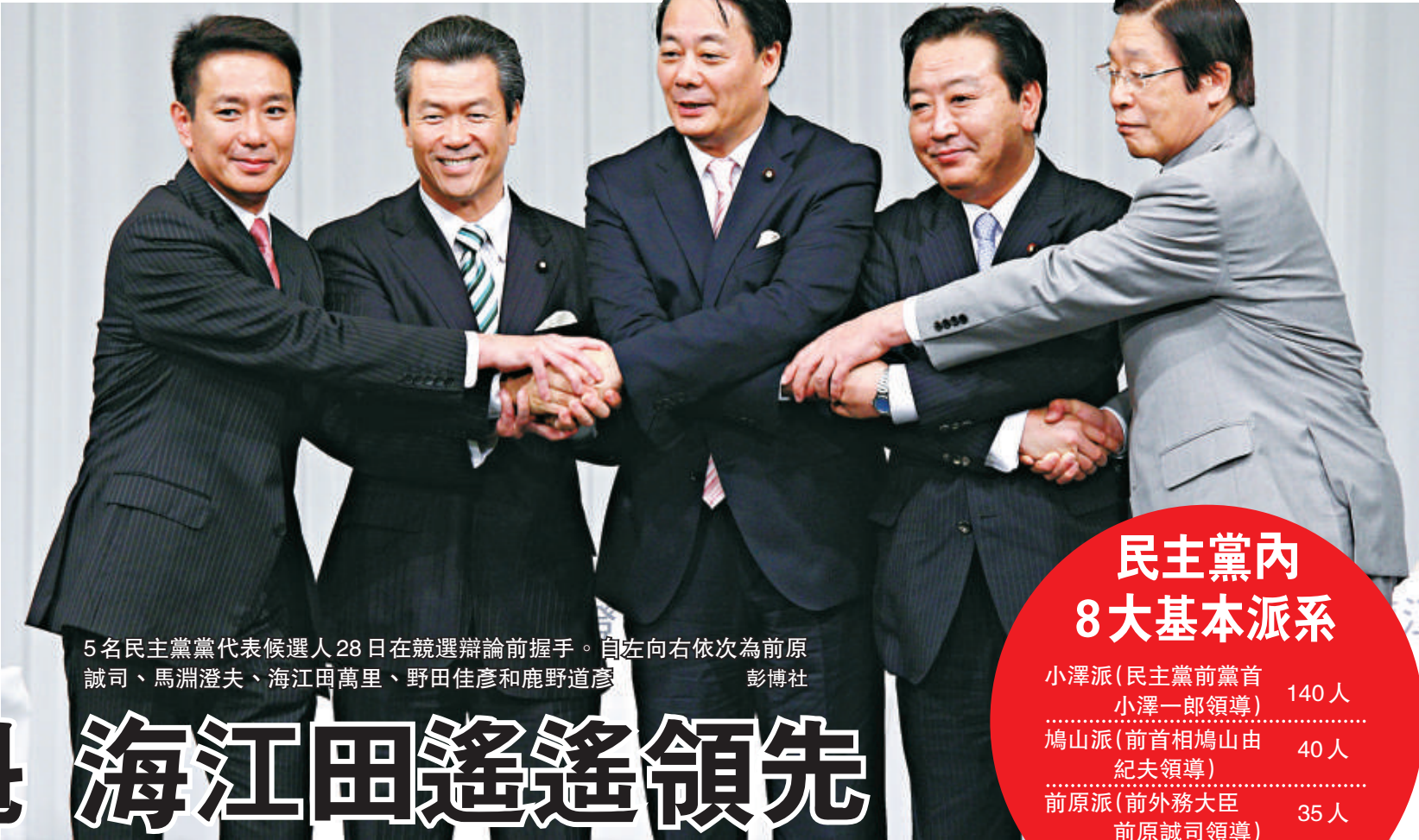
5名民主黨黨代表候選人28日在競選辯論前握手。自左向右依次為前原誠司、馬淵澄夫、海江田萬里、野田佳彥和鹿野道彥