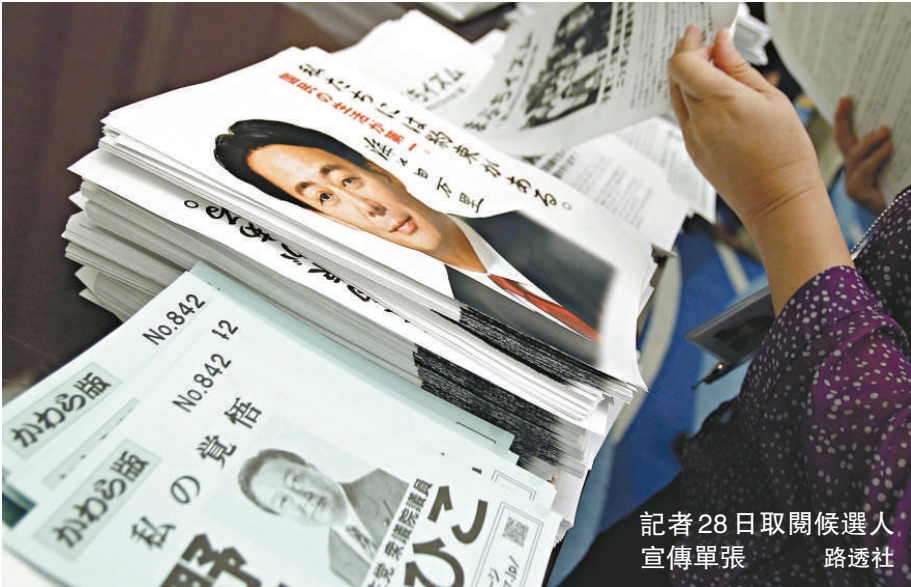
記者28日取閱候選人 宣傳單張