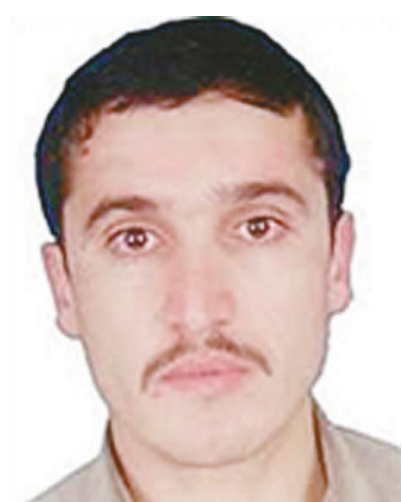
活動，接下來美軍將和情報部門加緊合作，逐一鏟除這些「基地」組織的關鍵人物。

自5月成功擊斃本·拉登後，美國愈發相信「基地」組織勢力正日漸衰微。7月美國新任國防部長帕內塔在首次訪問阿富汗時曾稱，現在「基地」組織主要行動成員已不到20人，多數在巴基斯坦、也門、索馬里等地