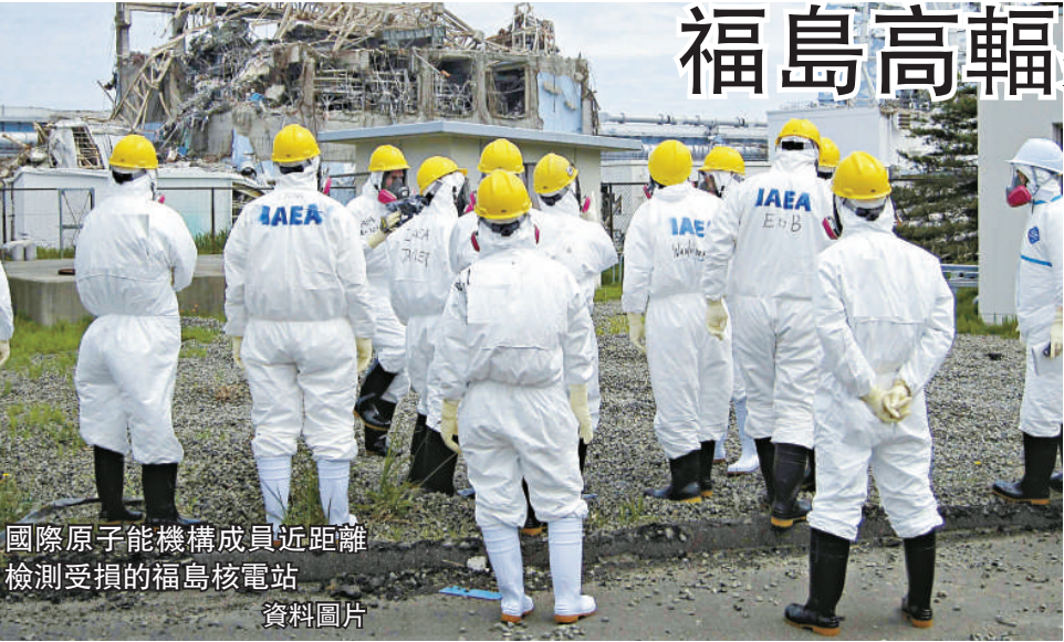
國際原子能機構成員近距離 檢測受損的福島核電站 資料圖片

【本報訊】據新華社東京28日電：日本政府日前在福島市舉行的「福島復興再生協議會」上宣布，因福島第一核電站事故而遭放射性物質污染的部分地區，每年的輻射量達到200毫希沃特，可能需要20年以上的時間污染才能降解，災民才可能回家。核電站事故擔當相細野豪志在協議會結束後的記者會上說：「今後將努力加快清除放射性物質。雖然必須竭盡全力，但是必須要直面很多人在相當長的時間內都難以回家的現實。」日本政府所推算的是，在不採取清除放射性物質措施的情況下，放射性銈-137和銈-134自然衰減，輻射量降低到每年20毫希沃特以下所需的時間。輻射量每年20毫希沃特是讓居民回家的安全線。根據推算，現在的輻射量在每年100毫希沃特的地區，要10年左右才能達標，而50毫希沃特的地區需要4年左右。日本政府26日公布清除放射性物質的基本方針，提出在今後2年時間裡，要通過自然力量減少40%的放射性物質，人工再清除10%至20%的放射性物質。