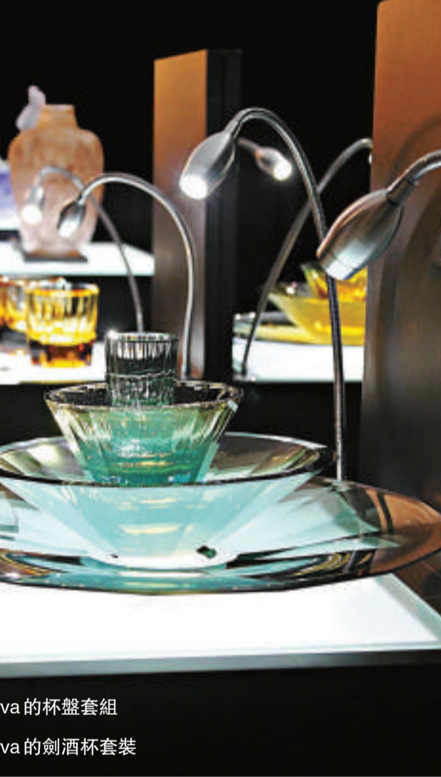
▲ Petr Larva 的杯盤套組