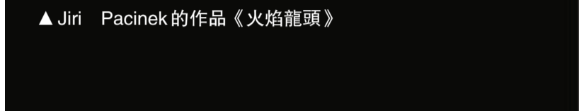
▲ Jiri Pacinek 的作品《火焰龍頭》