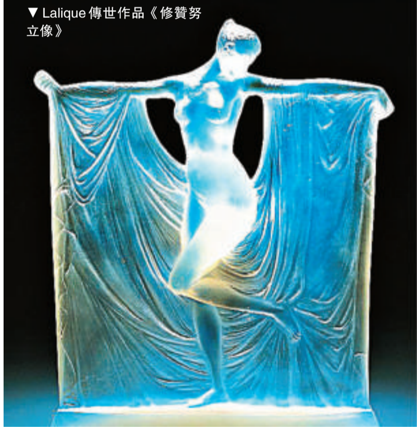
▼ Lalique 傳世作品《修贊努立像》