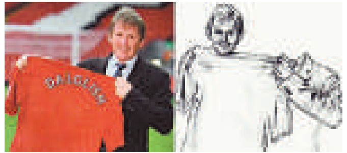
◀ 林愷倩作品《無題 24》

「印塔比替唇」展期至九月十日，Gallery EXIT 安全口畫廊位於中環善慶街一號。開放時間：星期二至六上午十一時至晚上七時。