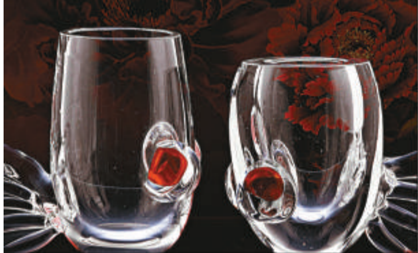
▲ Doubek 作品《河豚魚酒杯》