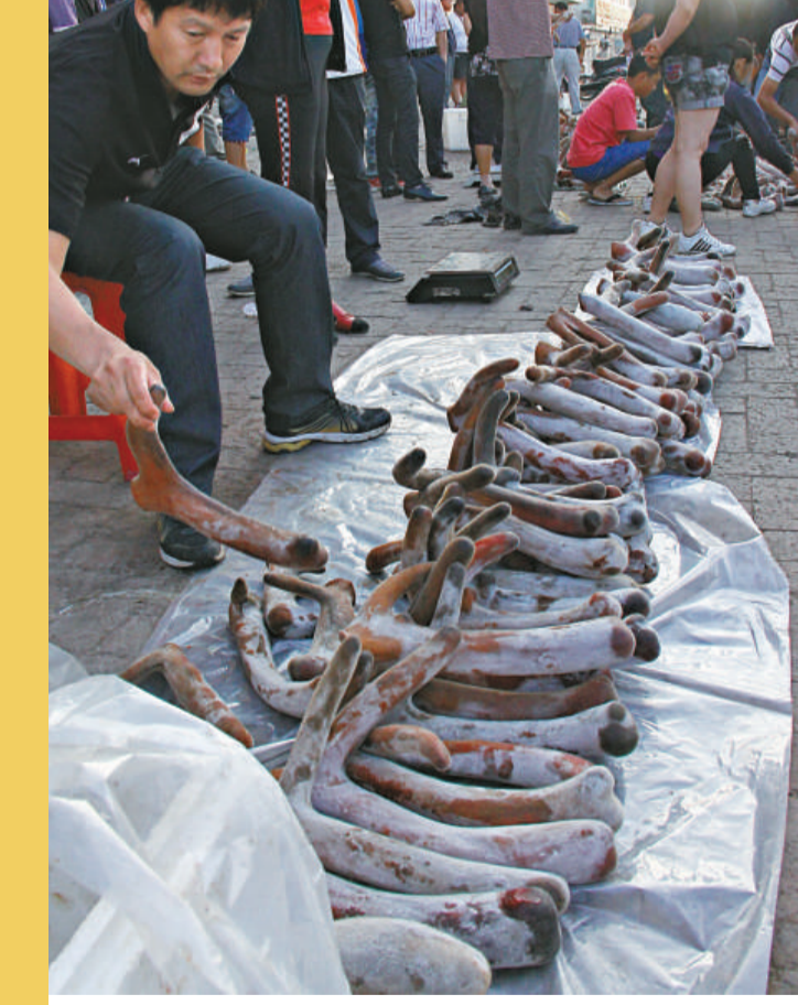
▲來自全國各地的商人每年都要到吉林收購梅花鹿茸

如今，梅花鹿茸的價格仍處漲勢。國內市場上，鮮茸平均價格每市斤700元左右，最高達到850元，較上年同期增長30%。乾茸價格突破每公斤5500元，較上年增長25%。鹿肉、鹿鞭、鹿胎等主要副產品價格，均較去年同期提升20%以上。 因各地飼養條件不同，所飼養梅花鹿品系不同，產茸量及茸質不同，因此準確預算一條鹿每年可盈利多少錢是很複雜的。