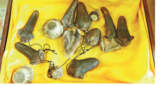
▲梅花鹿精加工產品禮盒

得天獨厚的投資熱點 全世界鹿的種類約有40餘種，分布在我們的有19種。梅花鹿主產於吉林、遼寧，馬鹿主產於黑龍江、新疆、四川。據中國畜牧業協會鹿業分會最新統計，我國目前梅花鹿的存欄量大約為100萬頭，年產鮮鹿茸320噸。其中，吉林現存欄梅花鹿佔全國的50%以上。