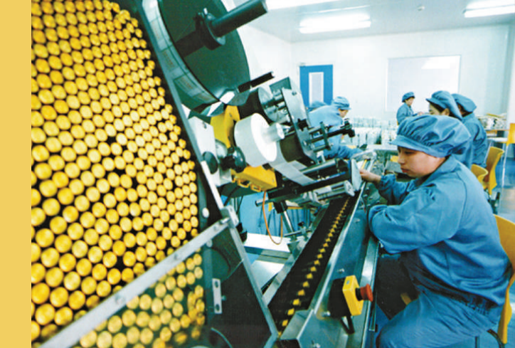
▲東豐藥業生產車間

必須根據實際情況來估計。但有一條可供參考，在東北圈養一條梅花鹿，每年消耗精飼料，加上粗飼料，費用在3000元左右。