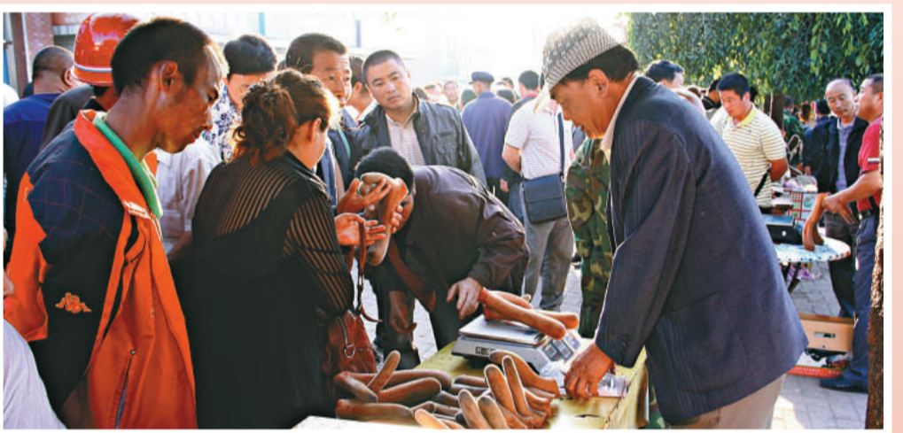
▲農民向收購商出售鮮鹿茸

「東豐梅花鹿」無形資產 梅花鹿是群居而膽小的動物，人工養殖時間長了，其近親繁殖的弊端就會出現，這對於動物業加工和種群繁衍不利。2003年，東豐縣年決定進行GAP認證。這決不是件簡單的事，說白了就是要給所有的梅花鹿進行族譜認證和登記，以便於在梅花鹿的交配季節避免近親繁殖。其中，最讓人痛惜的是，要將一些近親繁殖的品種淘汰，這就意味着要宰殺。鹿全身都是寶，殺一個就要損失上萬元。」