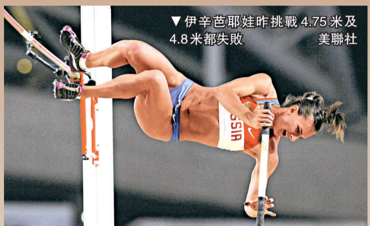
▼伊辛芭耶娃昨挑戰4.75米及4.8米都失敗