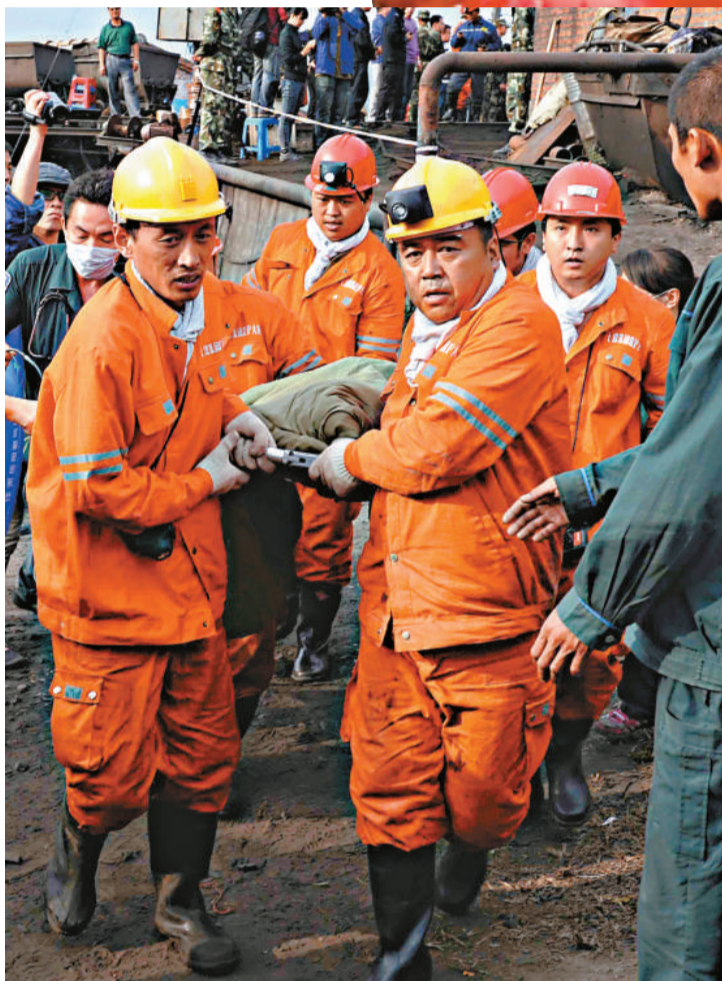
▲救援人員將獲救礦工抬離事故現場