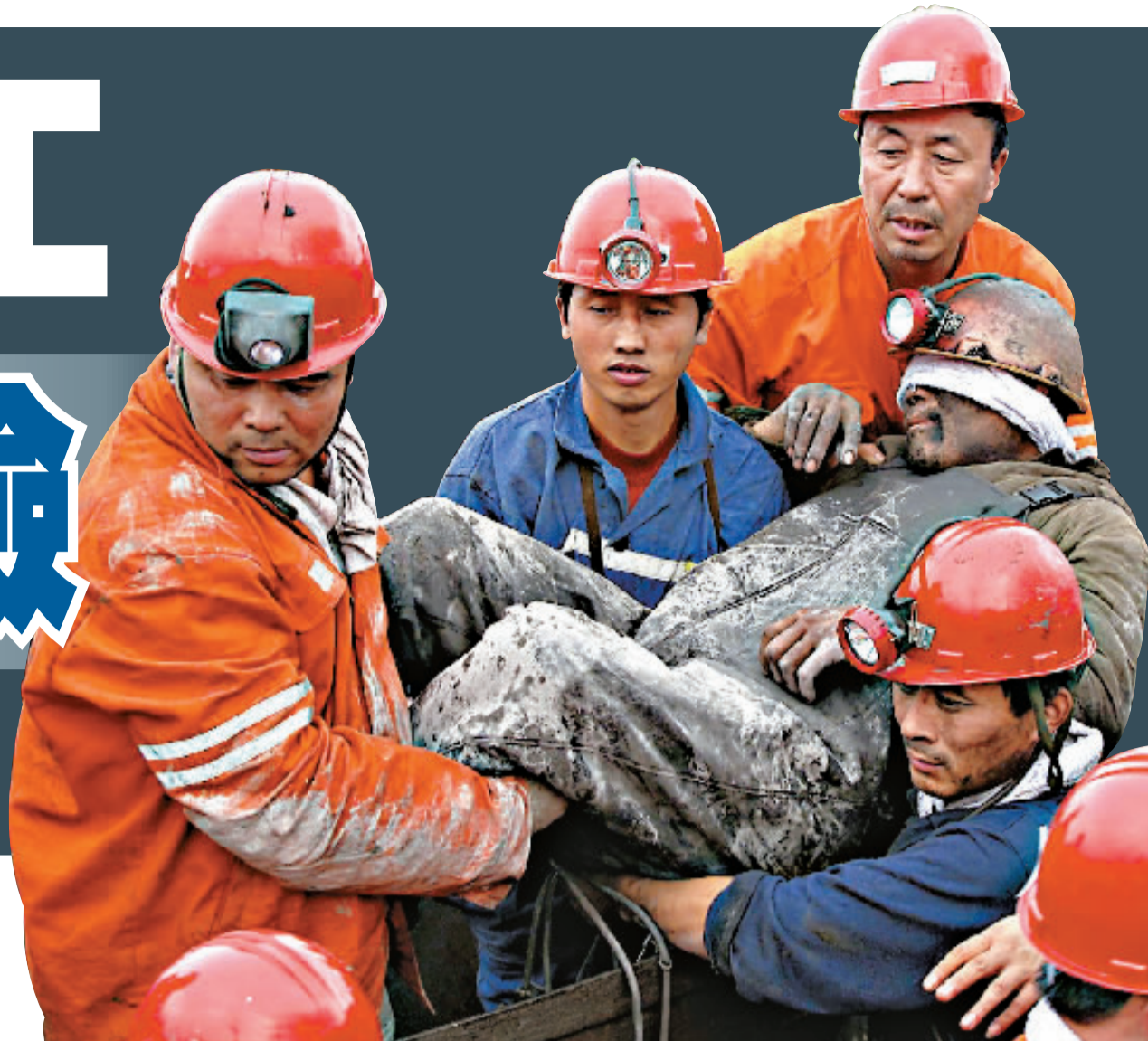
▲七台河煤礦透水事故救援人員30日在井下救出19名被困礦工