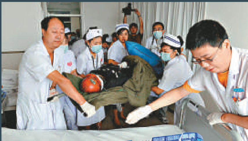
▲獲救礦工送抵醫院接受治療 新華社 ▶載着獲救礦工的急救車駛向醫院 新華社