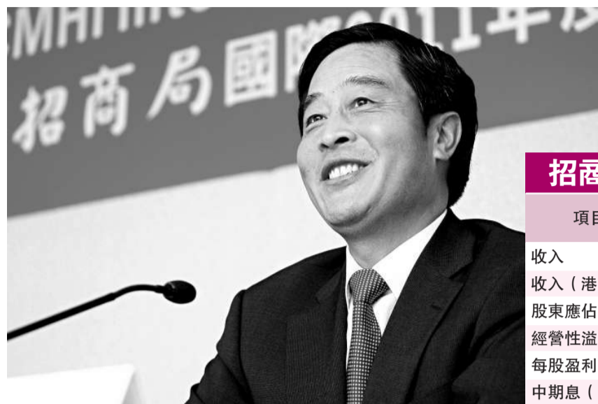
招商局國際副主席李建紅