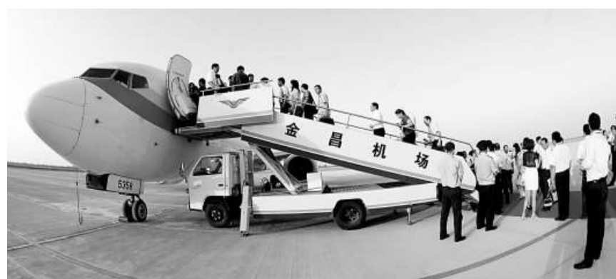
▲甘肅金昌市金川機場正式通航，該機場爲國內支線機場，航站區按滿足 2020 年旅客吞吐量 20 萬人次、貨運吞吐量 1200 噸的目標設計