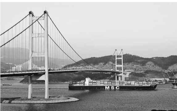
▲得力於香港海事處協助，招商局深西港口上半年開始掛靠 1.4 萬箱船，解決了經過青馬大橋的技術問題，圖為地中海航運大型貨櫃船通過青馬大橋

招商局國際董事總經理胡建華昨日在公布中期業績時，談到深西港口上半年開始掛靠 1.4 萬箱超大型貨櫃船，完全得力於香港海事處的協助，解決了青馬大橋淨空高度容許超大型船經過的技術問題，以致深西港口貨櫃單船裝卸能力可與香港港口媲美。