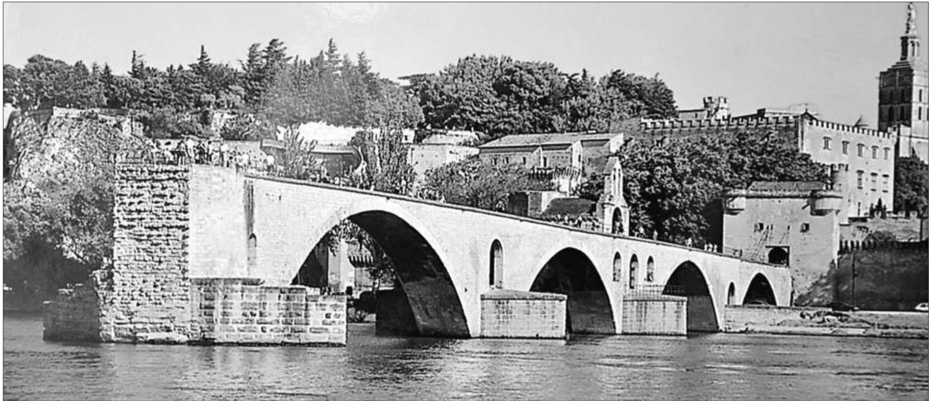
法國著名的阿維尼翁橋

在車頂上隨着音樂扭動身體，空氣中還飄揚著燒烤的芳香。在車頂上隨着音樂扭動身體，空氣中還飄揚著燒烤的芳香。在車頂上隨着音樂扭動身體，空氣中還飄揚著燒烤的芳香。在車頂上隨着音樂扭動身體，空氣中還飄揚著燒烤的芳香。