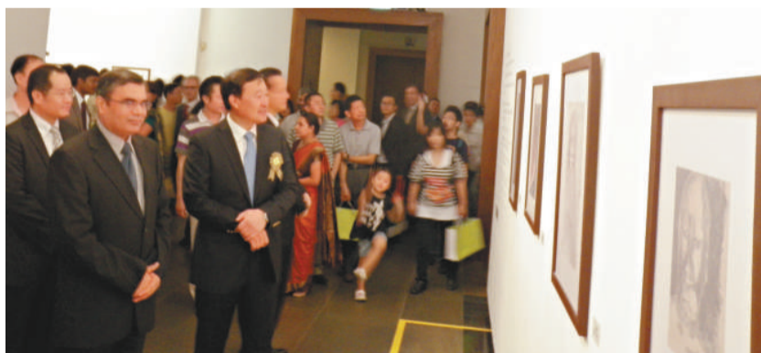
▲觀眾觀看泰戈爾作品