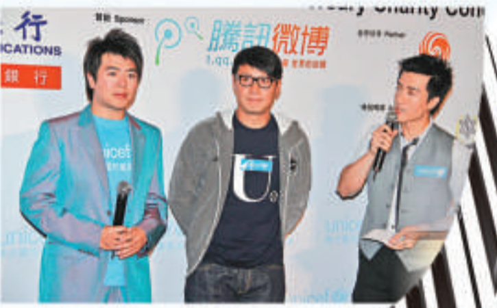
▲八月六日，郎朗（左一）與黎明等藝人一同出席世界自然基金會親善大使活動

後來，他在巴倫邦姆影響下接觸德奧學派，透過練習李斯特了解匈牙利學派的指尖技巧，也能接受音色浪漫絢麗的法國學派。「德奧學派用的是鐵砂掌的功夫，俄羅斯學派講究用氣功，用德奧的方法彈