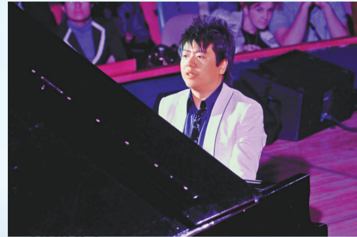
▲郎朗在紐約聯合國總部爲「三〇九聯合國日」音樂會演奏