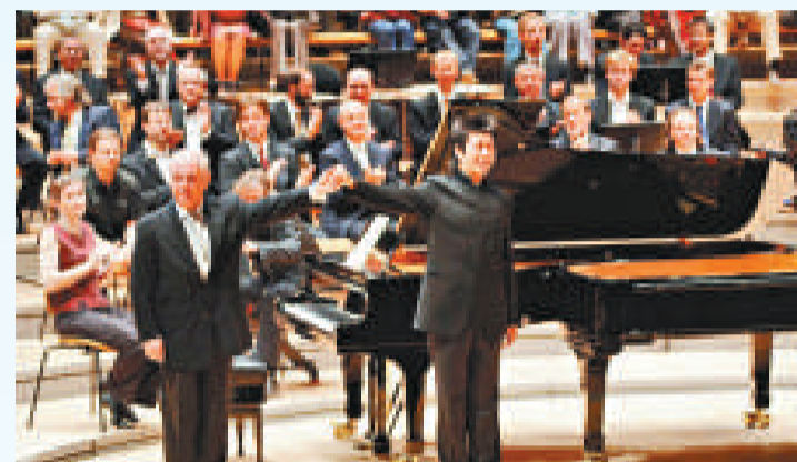
▲鋼琴家兼指揮家巴倫邦姆（左）曾與郎朗多次合作舉行音樂會

不過，並非人人都誇郎朗是天才。有樂評人說郎朗肢體語言大誇張，也有樂迷直言「不敢看郎朗彈琴時動輒四十五度仰望天空的表情」。而郎朗口中那個「服郎朗服得不得了」的托馬西尼最近爲《紐約時報》撰文，將現今鋼琴演奏家分爲「能演奏任何曲目」和「只演奏擅長曲目」兩種類型。郎朗，九歲練「柴一」十三歲彈「拉三」的郎朗，自然成爲前者的代表。在托馬西尼看來，技術型演奏家憑卓越技巧，不懼任何高難曲目，但他們對樂曲的詮釋因炫技和表意誇張而不