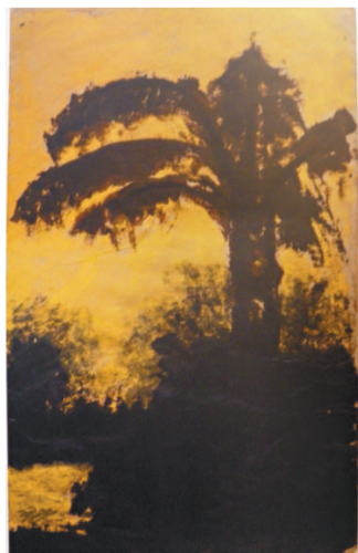
▼泰戈爾《香蕉樹習作》