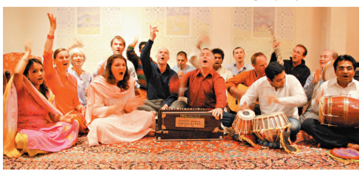
▲澳洲Music of Joy來港舉免費音樂會