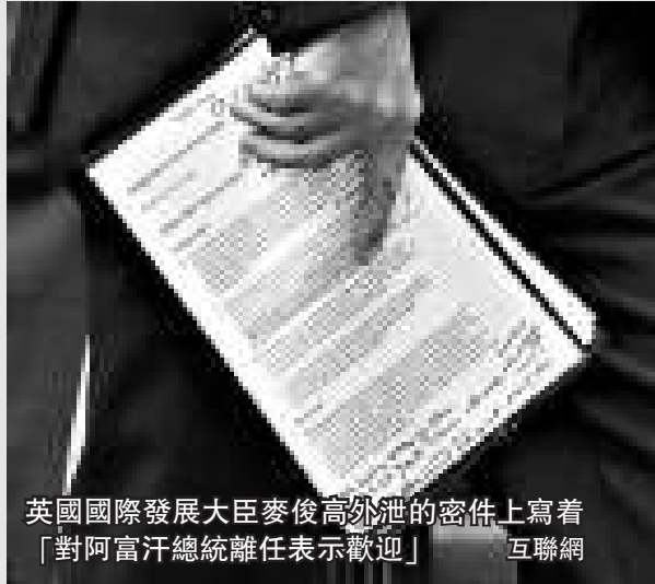
英國國際發展大臣麥俊高外泄的密件上寫着「對阿富汗總統離任表示歡迎」

這次走漏機密事件，恰恰發生在一個特別敏感的時刻，因為英國正準備從阿富汗撤走其9000名戰鬥部隊中的大批士兵。這些文件，對卡爾扎伊準備在2014年第二期結束時下台的計劃作出了評論。2014年也是北約把安全責任移交給阿富汗政府的時候。卡爾扎伊被迫表示，他將遵守阿富汗憲法，不尋求第三次連任。