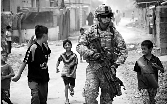
▲美國發動伊拉克戰爭，切尼在回憶錄中為這場戰爭辯護