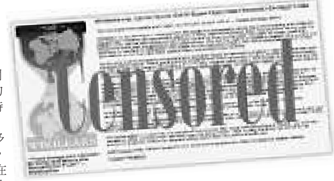
▲爆料網站「維基解密」早前曾公開大量美國外交密電

《紐約時報》曾為「維基解密」最佳盟友，多次幫該網站公布機密電報，但8月29日的報道稱，在新一波密電公開的姓名中，包括了一名聯合國在西非的高層與東埔寨的人權鬥士，但這兩名人士在與「維基解密」接觸時均是以匿名方式發表言論，該報道指「維基解密」沒有保護消息來源。