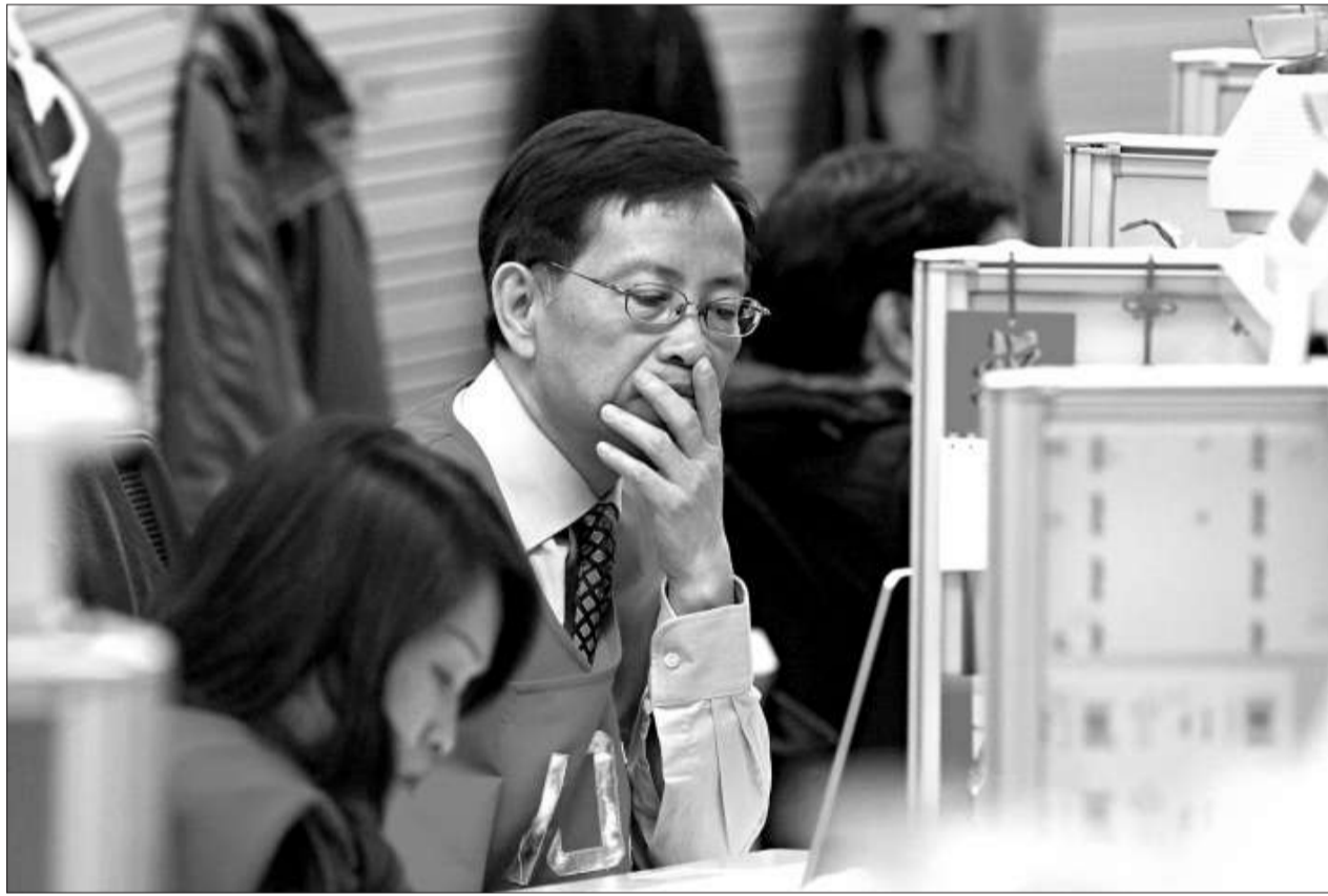
▲大市波動藍籌逐隻洗，投資者再度恐慌