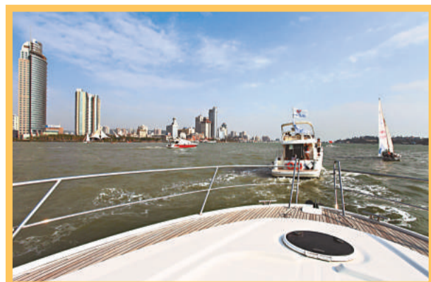
▲ 帆船遊艇巡遊鷺江

● 旅遊集散中心 ： 思明區發揮得天獨厚的旅遊資源，積極發展康體健身、濱海度假、遊艇觀光等休閒旅遊，抓好各類星級酒店建設，帶動旅遊與商貿、餐飲、會展等行業的發展；抓住兩岸之間、廈門與周邊交通條件的改善，積極發展對台旅遊、周邊省市互遊。