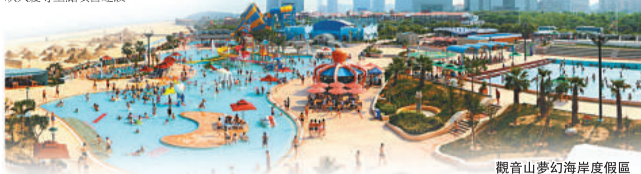
觀音山夢幻海岸度假區

思明區圍繞推動科學發展新跨越，繼續打好「五大戰役」，積極做好帝元維多利亞大酒店、凱裕國際大酒店、曾厝垵觀海度假村、廈門日航酒店、泰谷酒店、曾厝垵海鮮坊等開竣工項目準備工作，抓實抓好源昌凱賓斯基大酒店、世茂海峽大廈等重點項目建設。