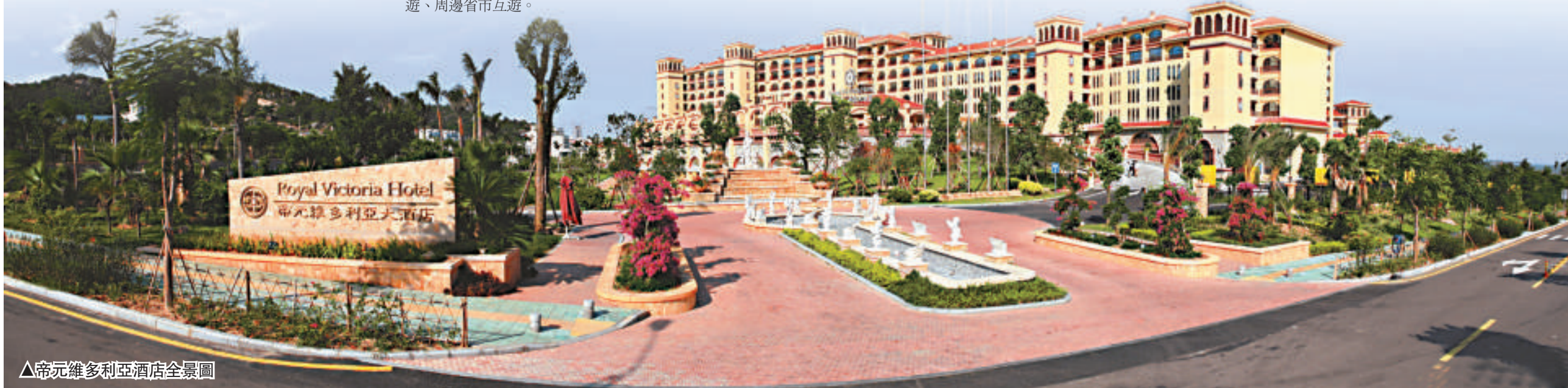
▲ 帝元維多利亞酒店全景圖

思明區緊緊圍繞全面構建幸福思明這一宏偉藍圖，着力產業發展創新，着力社會管理創新，着力行政管理創新，努力打造成爲「宜居、宜遊、宜學、宜商、宜業」的中心城區，全面構建居民更加富裕、社會更加和諧、生態更加優良、文化更加繁榮、生活更加舒適的幸福思明。