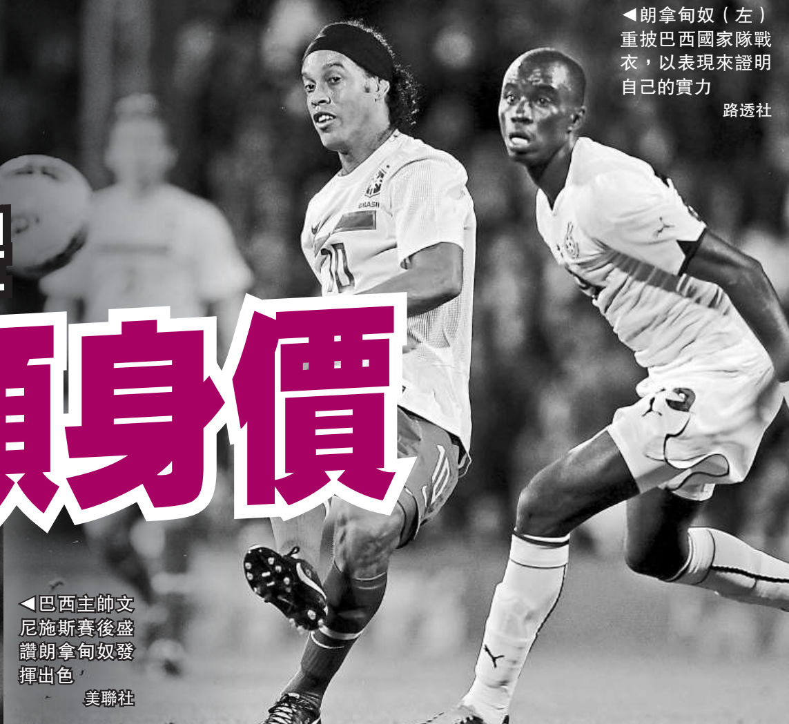
◀朗拿甸奴（左）重披巴西國家隊戰衣，以表現來證明自己的實力