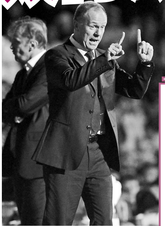
◀巴西主帥文 尼施斯賽後盛 讚朗拿甸奴發 揮出色