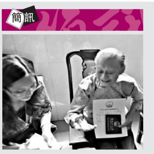
▲自梳女恢復中國籍後很开心

亦有專家認為，「彭宇案」後，老人摔倒無人攙扶的現象輪番上演，說明現在社會的信任基礎非常脆弱，而不是人們缺少救助技術能力。《指南》或許是為更好地維護社會公德，避免不必要的麻煩，但是要想從根本上回歸社會道德，扶起跌倒的老人，不至於讓社會有良知和同情心的公民因此泯滅愛心，還需要相關的法律出台作為根本保障。 據中新社