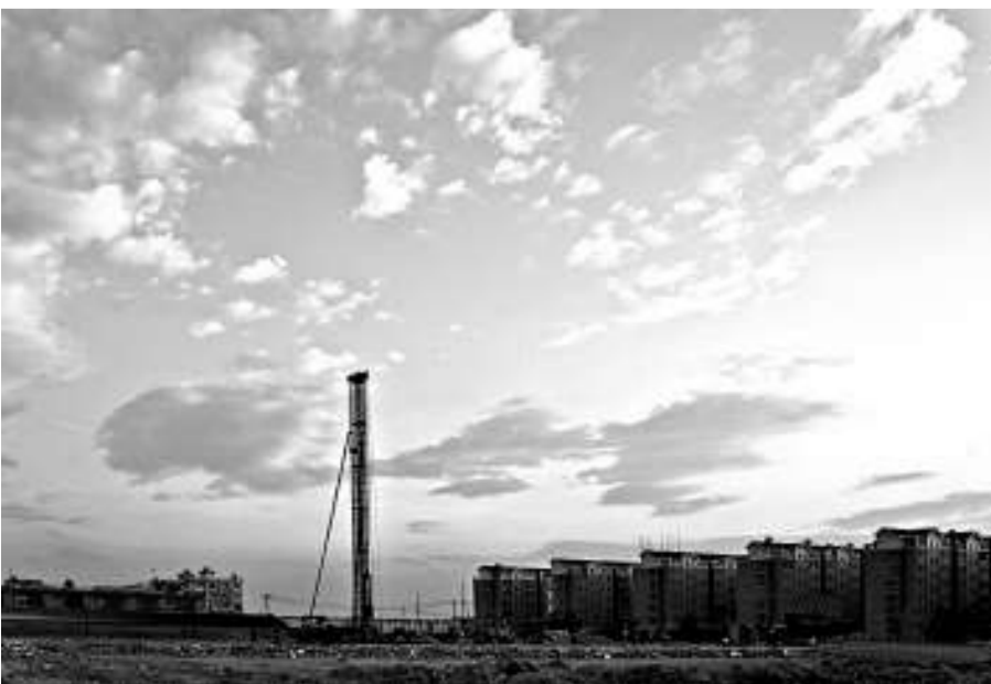
▲在限購令「疑雲」籠罩之下，內地二三線城市的房地產市場觀望氣氛濃

對於上述現象，一些業內人士和專家認為，內地房地產市場或將迎來深度調整期，濃厚的觀望情緒可能會使一些小房地產商及中介機構面臨洗牌。