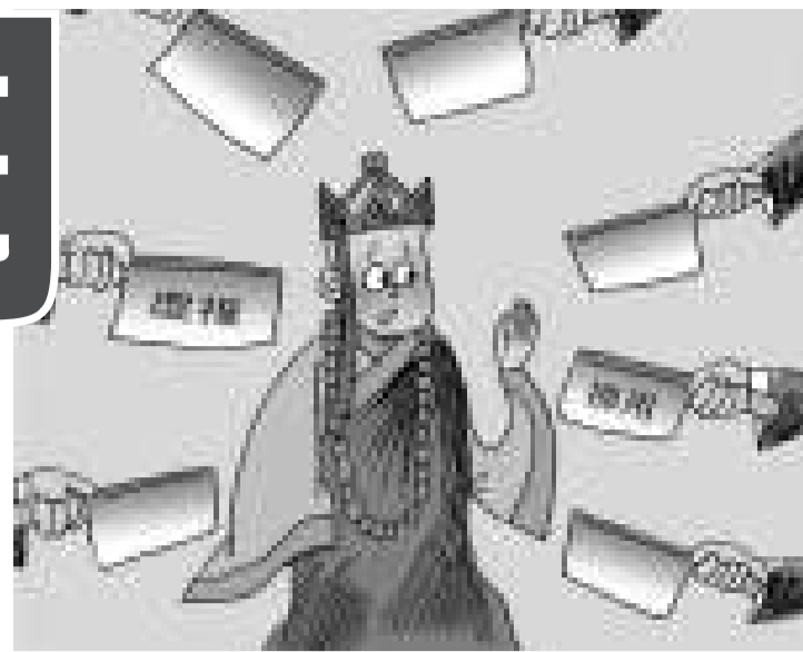
▲調查顯示，有科研人員通過虛報經費、收集發票充抵等手段將科研經費放入個人腰包 網絡圖片

此外，許多單位對課題組使用科研經費不加限制，科研經費在報銷過程中存在嚴重的違紀違規現象。「每次課題結項都是最忙的時候，到處收集發票。」一位博士這樣對媒體表示。大到房與車，小到給孩子買個鉛筆，家庭日常用品費用更常常出現在科研經費報銷單中，造成大量的科研經費並未真正用於項目研究。一些專家建議，科研立項和經費投入應納入公共監督之下，並建立規範的審審機構和評審程序。入選的科研項目應向全社會招標並公示，項目的開展和完成要有評估，並且要讓社會各界有渠道了解科研經費的使用及產生的效益。