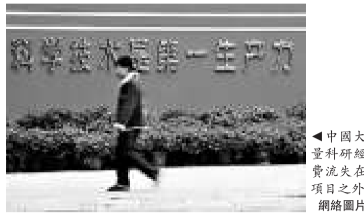
▲中國大量科研經費流失在項目之外 網絡圖片