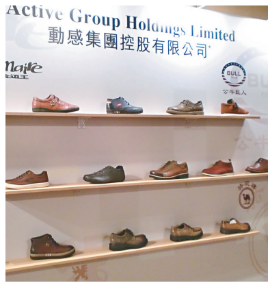
▲動感集團昨推介表示，三成集資額將用於建造江蘇新廠房

據《路透社》昨日報道，天福茗茶已引入私募基金美國泛大西洋投資集團為基礎投資者，後者將購買天福公開發售35%的股份。該股將於下周啓動路演，9月14日招股，21日定價，26日掛牌，擬集資約3億美元（約23.4億港元），承銷商包括中金、瑞信及寶來證券。據保薦人中金預計，天福今年預測市盈率約20.7倍至27倍。