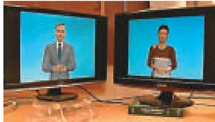
▲兩名電腦機器人「交談」的影片在互聯網上吸引眾多點擊率