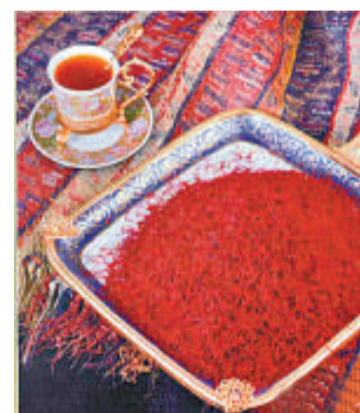
▲英國科學家日前發現，藏紅花可提煉成抗癌藥

這種新藥主要由藏紅花中的秋水仙鹼提煉而成，但仍處早期研究階段，迄今只在老鼠身上測試過。（中新社）