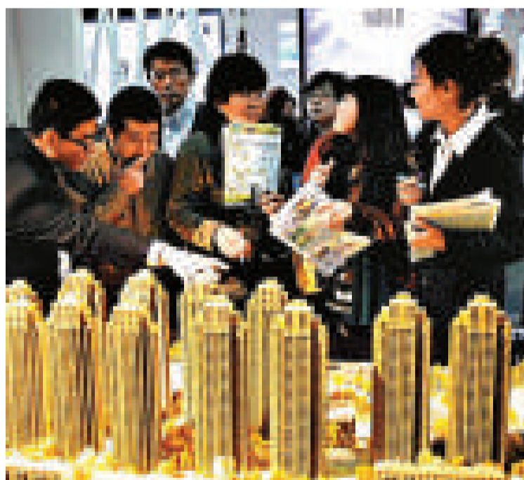
▲中國房地產業近來蓬勃發展，致使該領域的多家企業躋身上市企業 50 強