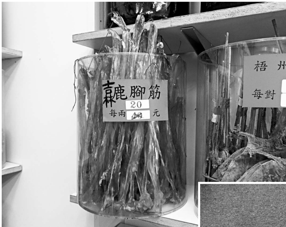
海關檢獲的假冒鹿筋

他說，要分辨鹿筋真假，可從體積、質感及光澤三方面着手。用牛筋冒充的假鹿筋，體積明顯較大，用手觸摸可發現質感較粗糙，且表面缺乏光澤。呼籲市民購買參茸海味時，應光顧信譽良好的店舖。