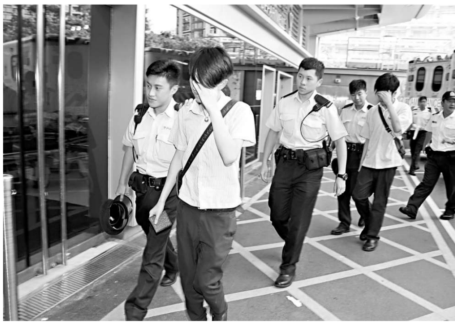
差館里學生群毆部分被警員帶走

【本報訊】紅磡差館里昨日爆發兩幫學生群毆大混戰。一名曾涉及兩年前何文田區「學生開片」的學校小霸王，轉校後因與一名女同學交惡，兩幫合共十多人昨日街頭仇人相見，互相指罵後火併，追逐互毆殺聲震天，部分人校服亦被扯爛。一名交通警察目擊喝止不果，需大批警員增援，結果拘捕六人，其他人趁亂逃去。