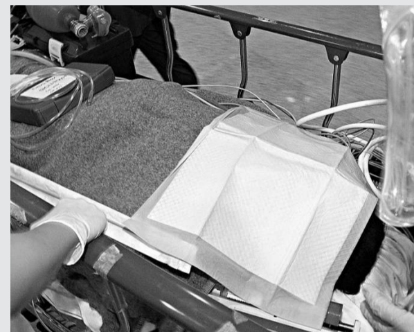
汀角路車禍傷者被送院

警察衝鋒車等接報趕抵調查，女司機拒絕合作，還不停打電話找人傾訴邊邊講嘔，並拒絕接受酒精呼氣測試，擾攘近一小時後，被警員當場驗出她飲酒超標，涉嫌醉駕被捕。由於她拒絕到醫院檢查，警員遂將她帶返警署繼續調查。其男友人事後到場，代為將跑車駕走。