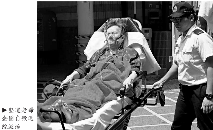
堅道老婦企圖自殺送院救治