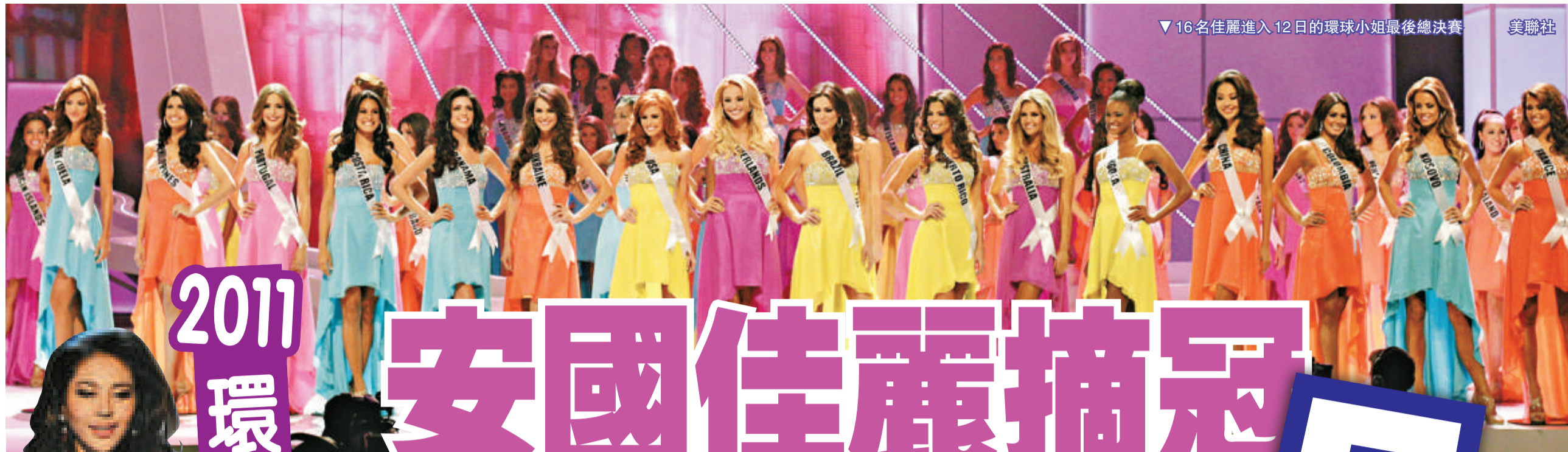
▼16名佳麗進入12日的環球小姐最後總決賽