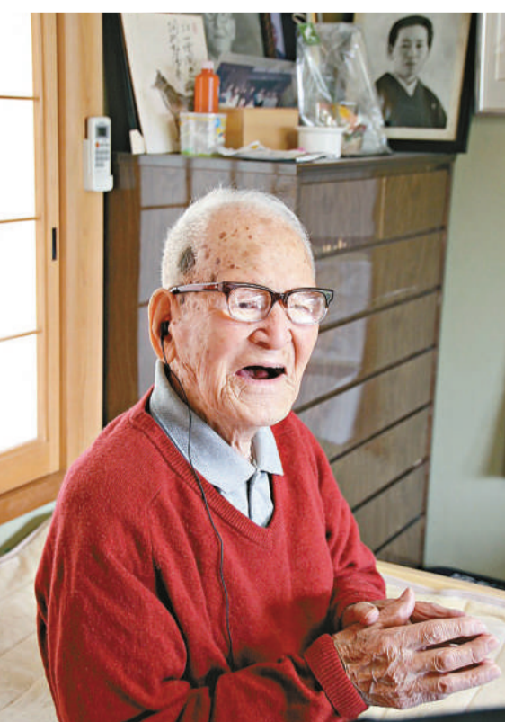
▲現年114歲的木村次郎右衛門已作爲全球最長壽男性列入健力士世界紀錄 互聯網

日本厚生勞動省在「敬老日」到來之前實施的調查結果顯示，今年日本百歲以上老人達到47756人，人數創歷史新高。今年比去年增加3307人，連續41年保持增長，且男女人數均創新高。島根縣連續兩年成爲百歲老人比例最高的地區。