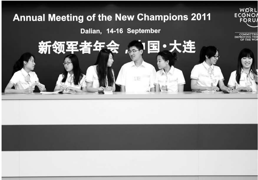
▲十三日，在大連世界博覽廣場上，工作人員在服務台進行夏季達沃斯論壇服務準備工作