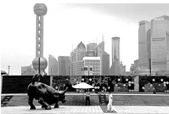
▲惠譽欲下調中國本幣債信評級，人民日報海外版撰文反擊。圖為上海金融中心區

業內人士呼籲，中國作為債權國，應該爭取國際評級話語權，支持本土評級機構發展，建立符合中國國情的統一信用評級從業機構認證制度。