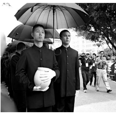
▲護靈者手捧裝着中國遠征軍遺骸的骨灰罐

下午1時，靈車在騰沖縣城西南的國殤墓園附近停住。按照當地風俗，騰沖鄉賢在此為遠征軍忠魂主持迎靈儀式，安樂曲奏起，身着黑色中山裝的護靈者手捧骨灰罐，在手執黑傘的另一位護靈者護衛下，緩步進入國殤墓園忠烈祠。數千名自發前來的騰