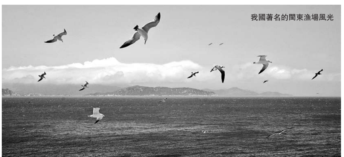
我國著名的閩東漁場風光

由中華人民共和國農業部、福建省人民政府聯合主辦的2011海峽(福州)漁業周、第六屆海峽(福州)漁業博覽會(簡稱「漁博會」)將於9月16—18日在福州海峽國際會展中心隆重舉行。在海峽兩岸業界的共同努力下，本屆漁博會進一步朝向規模大、檔次高、內容新、展品豐等特色發展，並已成為內地最具影響力之一的漁業盛會。而福建省會福州，所扮演的兩岸漁業交流對接平台的角色也越發精彩。 文 史兵