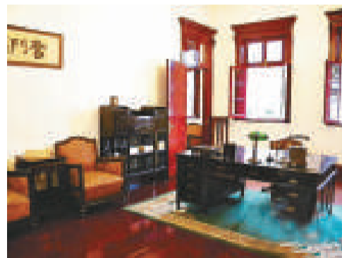
孫中山的辦公室內部陳設參照了史料照片，嚴格按原樣布置

【本報訊】南京「總統府」內的「西花廳」曾是孫中山臨時大總統的辦公室，在今年紀念辛亥百年之際，首次進行徹底修繕。「用百天時間修繕百年建築來紀念辛亥百年」。南京「總統府」副館長王衛稱。