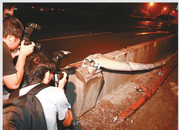
大巴撞上欄杆發生側翻

【本報記者楊楠、倪曉晨上海十五日電】14日20時54分，在上海外灘線近龍東大道附近一大巴側翻，造成7人當場死亡，4人送醫院搶救無效後死亡，另有13人不同程度受傷。