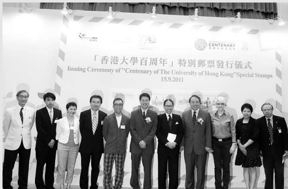
▲「香港大學百周年」郵票昨舉行發行儀式