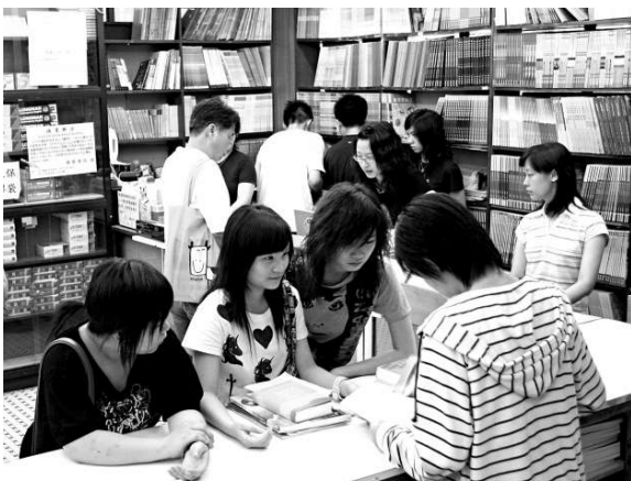
▲消委會調查指，今年教科書格價，小學升中學跌

兩大教科書出版商回應稱，本港通脹持續高企，已盡量克制，僅微調書價。消委會表示，今年有不少學校於電腦科採用電子書教學，其費用較傳統課本低。另外，消委會透露，今年投訴有關買教科書的數字，首八個月有四宗，包括投訴銷售手法及錯誤版次，去年全年則有十六宗投訴。