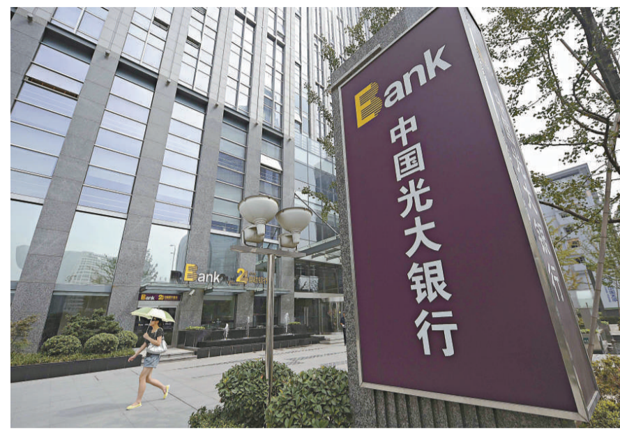
▲推行金融資產證券化有利銀行加強負債風險管理

理確定業務和利潤增長目標，建立以質量效益和風險為核心的薪酬機制；同時加強資本約束，推動股份制商業銀行由過去的主要依靠外部融資轉向內部開源節流，通過內部轉移定價實施不同業務資本佔用水平的考核，強化資本管理。