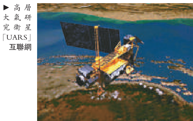
► 高層大氣研究衛星「UARS」互聯網