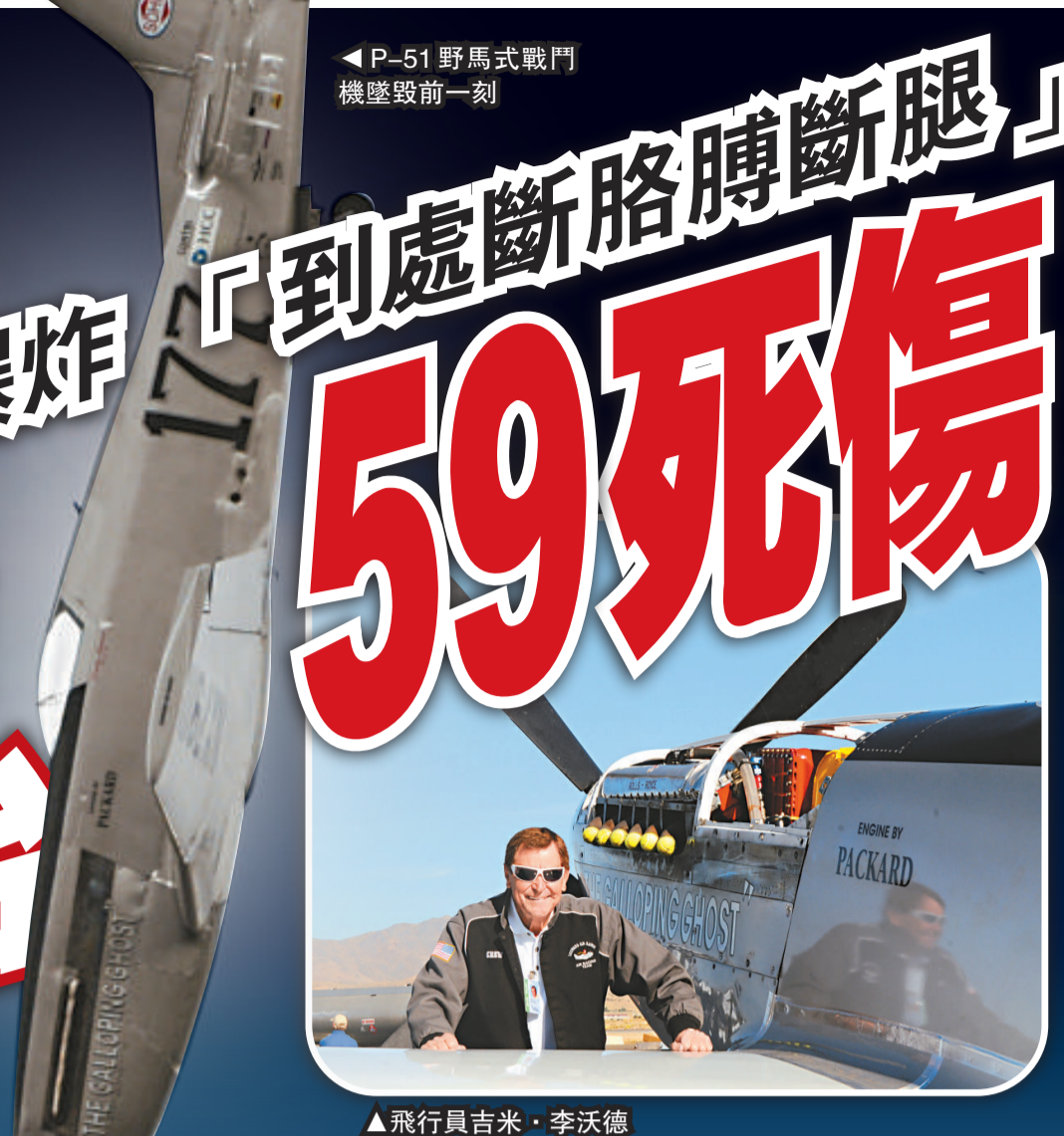
← P-51 野馬式戰鬥機墜毀前一刻