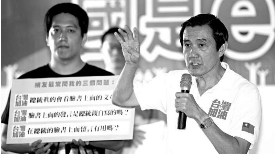
▲馬英九（右）17日到高雄西子灣沙灘會館，與網友舉行首場見面會時說，他的臉書（face book）9月8日已衝破100萬人按讚（支持），非常感激網友支持。

馬英九話鋒一轉表示，現在有人提出「台灣共識」，最大問題是沒人知道內容是什麼。他舉預售屋為例，如果有人賣屋，只是告訴買家要提供一棟理想的住宅，至於房子長什麼樣子、有幾個房間、幾套衛浴設備，「當選後再告訴你，這樣的話，你要不要買？就請你仔細想想」。馬英九說，維持台海安定非常重要，也正因為這是雙方的事情，不能全部由台灣說了算，兩岸要達成共識，才能讓兩岸關係穩定下來。他也說，執政3年多來，一直努力維持兩岸關係，目前民調支持率最高的就是兩岸「維持現狀」。