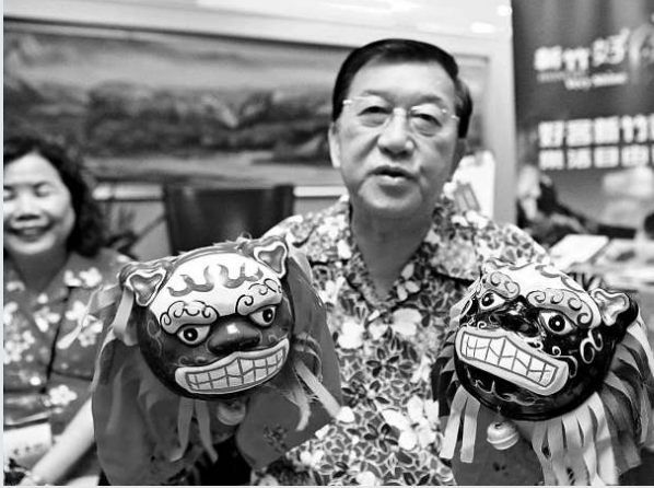
▲17日，台灣新竹縣在蘇州舉辦觀光暨名品營銷會。圖為台灣新竹縣縣長邱鏡淳展示具有濃郁客家風情的「獅頭」手偶。

據悉，參加此次研討會的辛亥革命和海軍名將家族代表約有50位，包括船政大臣沈葆楨家族、船政大臣魏瀚家族，黃花崗義士林覺民、林尹民家族，海軍主力戰艦起義領導人、民國第一任海軍總長黃鐘瑛上將家族，海軍起義第一艦領導人林舜藩家族等。