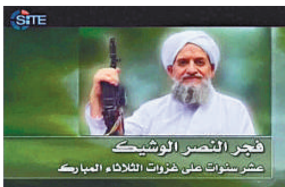
▲「基地」組織12日發表新頭目扎瓦希里的講話視頻 資料圖片

里。這個現任「基地」一號頭目一直被認為更善於收集情報而非策劃行動，上周他公布了一段62分鐘的錄像，名為「接近勝利的曙光」，並稱他祈禱今年的「阿拉伯之春」後，緊跟的是「黑暗，苦寒的美國之冬」。