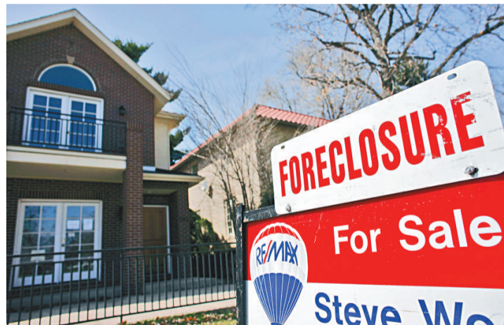
▲美國房地產市場疲軟，房屋空置無人問津 資料圖片

【本報訊】據美聯社華盛頓18日消息：雖然現時在華盛頓，主要話題是高失業率，但是對很多2012年的選民來說，房屋貸款危機也許是一個更有力的證據，證明經濟的不景氣程度。對奧巴馬來說，住房政策也成