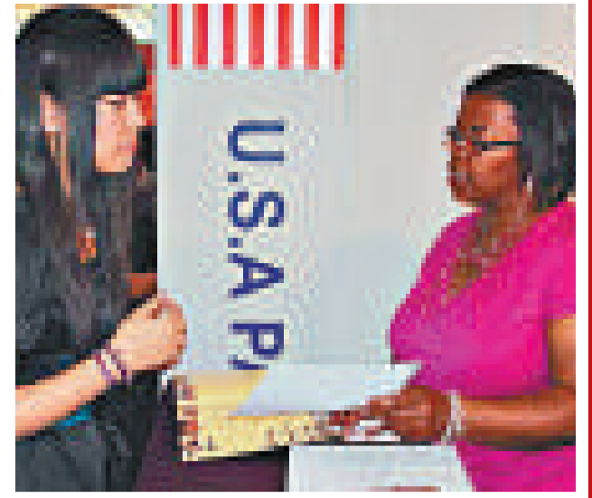
▲美國是中國留學生的首選之地

另據中國教育部公布的數據顯示，截至去年底，我國以留學身份出國、正在境外留學者的人數已達127.32萬人，中國留學生成境外教育市場「大蛋糕」。 據美國國際教育者協會估算，2010年國際留學生為美國帶來213億美元收益，其中中國留學生貢獻最大，該協會稱國際留學生成為拯救美國部分地區衰退經濟的重要力量。 早在2008年，國際學生就為加拿大貢獻了65億加元，成為加拿大最大宗的涉外經濟收入，其中，華裔學生貢獻率佔三成。目前，加拿大政府希望把留學教育打造成該省第三大經濟產業。