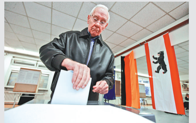
▲德國柏林18日舉行地方選舉

【本報訊】據路透社柏林18日消息：德國首都柏林周日舉行地方選舉。預料總理默克爾領導的保守派「基督教民主聯盟」可能再次受挫。今年以來執政黨在地方選舉已遭遇5次失敗。 柏林的地方選舉在香港時間下午2時開始，晚上10時投票完畢不久便會有票站預測。根據早前的民調，在當天的柏林選舉中，默克爾的基民盟得票率只有22%左右，大幅落後社會民主黨。根據預測，立場中間偏左的社民黨將獲得大約31%的選票，會與綠黨或左翼黨共同執政。 此外，民調還顯示，默克爾聯合政府中的合作夥伴自由民主黨，得票率也將低於5%，可能會被踢出邦議會，屆時情況將更糟糕。 如果自民黨在柏林無法贏得5%選票，將是該黨今年7場選舉中第五次得票不到5%，這會讓自民黨面臨壓力，讓不受歡迎的外交部長韋斯特維勒下台。自民黨在2009年聯邦選舉中，得票創紀錄達到14.6%。但是民調顯示，這次自民黨將只能獲得大約2%的選票。 這次選舉中，另一個出人意料的是盜版黨，民調預測盜版黨將贏得9%的選票。盜版黨5年前在瑞典崛起，以改革著作權法、改善網絡時代的隱私為號召，德國盜版黨則是瑞典盜版黨的分支。