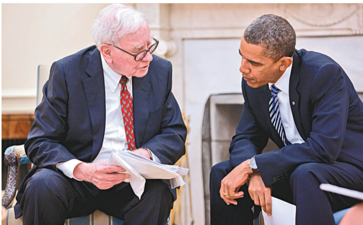
▲美國總統奧巴馬（右）去年邀請股神巴菲特到白宮會面，商討如何提振美國經濟 資料圖片

由於美國債台高築，8月份通過提高債務上限的決定時同時決定設立一個超級委員會專門負責削減財政赤字。要想削減財政赤字，途徑無非只有兩條，一是提高稅收增加收入，二是削減開支。 奧巴馬前幾天剛剛提出4470億美元的就業刺激計劃，為了給這一計劃提供資金，奧巴馬的辦法就是徵稅。之前，包括股神巴菲特在內的一些富人都表示，美國的稅收制度存在漏洞，這導致富人繳稅款從比例上講，實際上遠比工薪階層低。奧巴馬正好利用這一說法，將徵收對象瞄準富豪。因此，這一提案也被稱為「巴菲特議案」。 美國去年有1.4億人報稅，而這項「巴菲特稅」只會影響其中0.3%的納稅人，即不足45萬納稅人。 根據美國的所得稅法，稅率實行遞進制，依收入多少稅率分為10%、15%、25%、28%、33%與35%六個稅階。但資本利得的稅率統一規定為15%，而所謂的資本利得，包括股票收入、分紅以及利息等等。一般來說，富人的收入結構中工資收入只佔小部分，大部分都是資本利得。資本利得的稅率比較低會拉低他們總體的繳稅比率，而工薪階層工資所得多，稅率自然就會越高。另一點造成稅負差異的原因，是一般國民需繳交社交薪稅，偏偏此稅項不適用於10.8萬元以外的收入。正是在這兩種情況下，巴菲特在報章撰文，公開質疑自己去