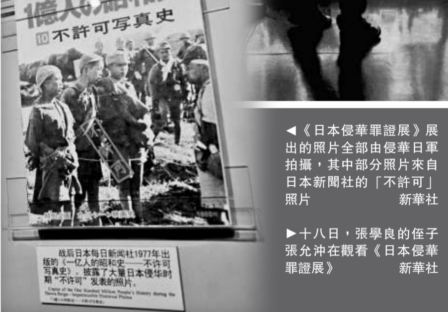
◀《日本侵華罪證展》展出的照片全部由侵華日軍拍攝，其中部分照片來自日本新聞社的「不許可」照片