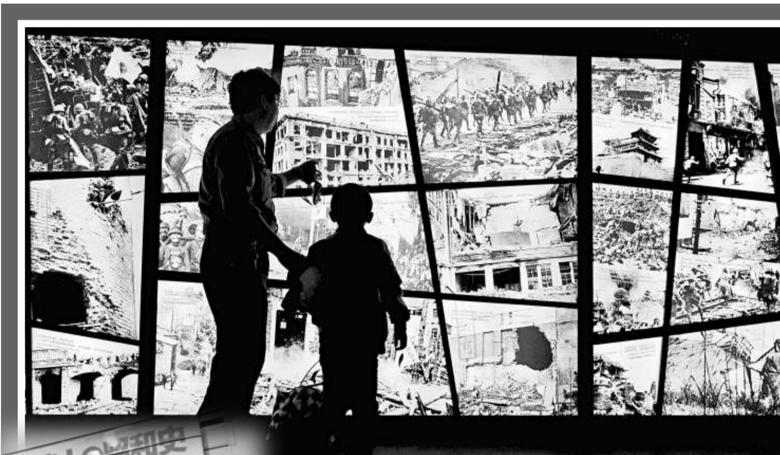
◀十八日，一名小孩在家長的帶領下觀看《日本侵華罪證展》