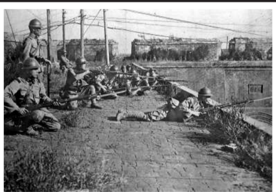
▲「九一八」事變次日晨，日軍在瀋陽外攘門上向中國軍隊進攻