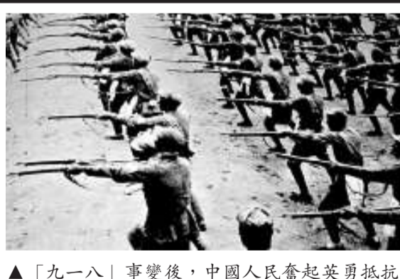
▲「九一八」事變後，中國人民奮起英勇抵抗。山西新軍是在中國共產黨領導下的一支抗日武裝，圖為山西新軍在進行刺殺訓練 資料圖片