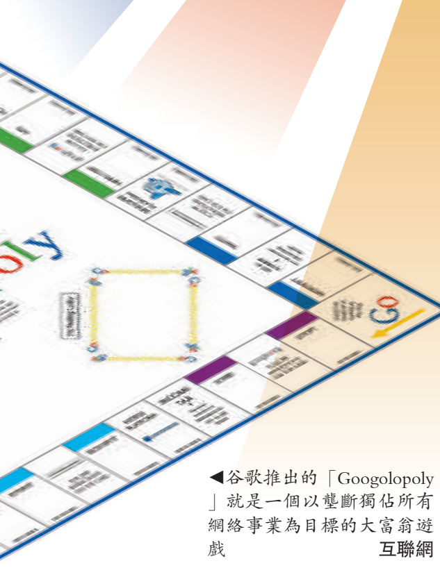
▲谷歌推出的「Googolopoly」就是一個以壟斷獨佔所有網絡事業為目標的大富翁遊戲