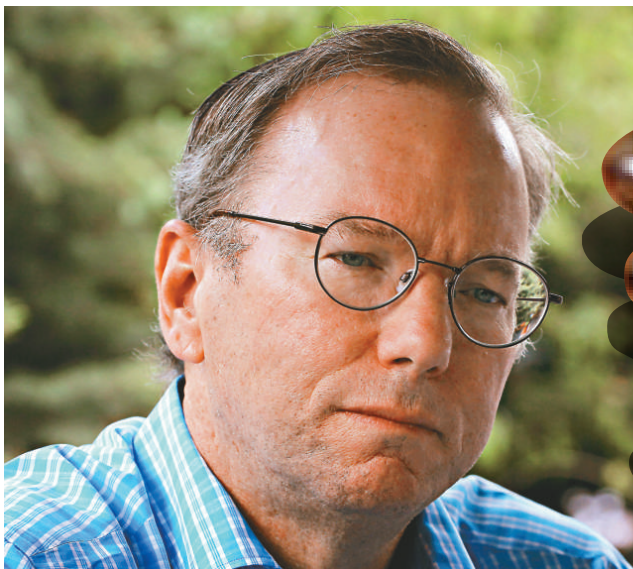
▲谷歌董事長施密特周三將出席美國參議院的聽證會