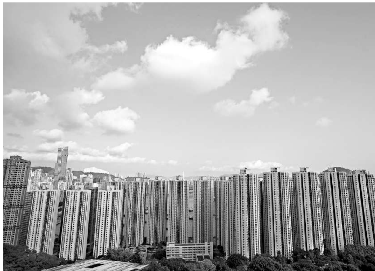
▲銀行連番調升按揭息，成為樓價出現較大調整的催化劑

上述各項中，有些並不直接涉及希臘方案，但由於市場上人心惶惶，故稍有風吹草動便引致恐慌。其實如果救希臘方案的一些技術性問題得到解決，則至少兩年內希臘不會有事，從而帶來較安穩的調整機會。九月中德法希三方領導會議後，法德力保希臘，而希臘將努力達成削減目標，但風波是否可得平息，還要看會否出現其他問題，故非十拿九穩。從長遠看，成敗與否要看希臘的財政收緊及經濟表現，所涉風險不少。