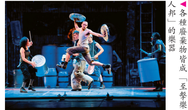
▲各種廢棄物皆成「至擊樂人邦」的樂器

示：「如果你未曾看過「至擊樂人邦」的演出，我誠意邀請你來親身感受這與別不同的「噪音」，如果你已看過「至擊樂人邦」，全新創作的部分將再度震撼你的心靈。」門票於快達票及香港會議展覽中心、香港演藝學院、亞洲國際博覽館、藝穗會、九龍灣國際展貿中心、演藝學院古蹟校園——伯大尼及各通利琴行發售。查詢詳情可瀏覽 www.lunchbox-productions.com 。