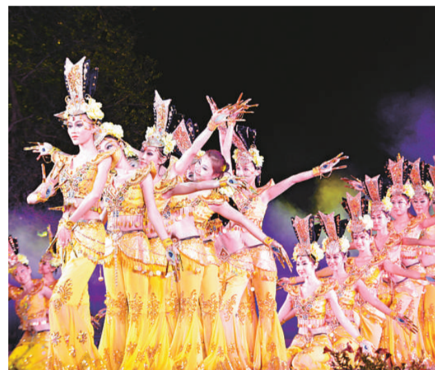
▲演員再現「千手觀音」