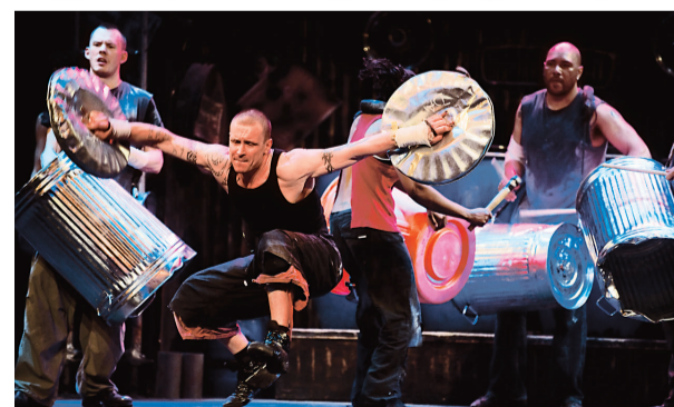
▲「至擊樂人邦」將喜劇、敲擊樂、戲劇及舞蹈共冶一爐

「至擊樂人邦」國際團隊至今共有一百名表演者，分散於五地製作團隊，包括兩個美國及一個國際巡迴表演團隊。榮獲 Olivier award 的「至擊樂人邦」，最近更於奧斯卡頒獎禮演出。導演史提夫·麥尼古拉斯(Steve McNicholas)表