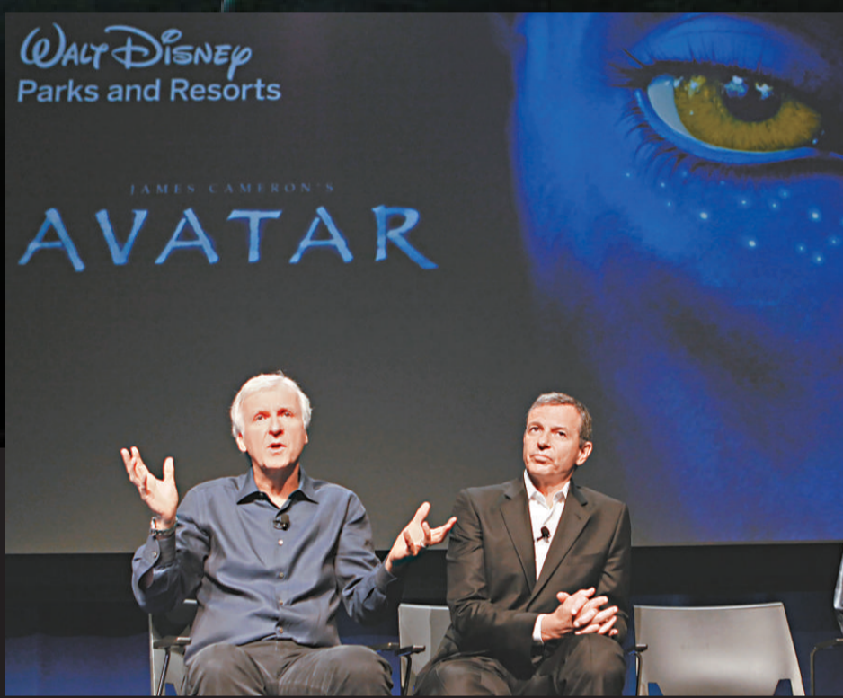
▲迪士尼總裁艾格爾（右）與《阿凡達》導演占士·金馬倫20日宣布合作計劃

消息人士說，迪士尼仍在與《哈利波特》電影製片商華納兄弟公司談判允許迪士尼在佛羅里達州以外的主題公園創造「哈利波特」景點的可能性；因為佛羅里達州內的獨家經營權，已賣給了環球電影公司。