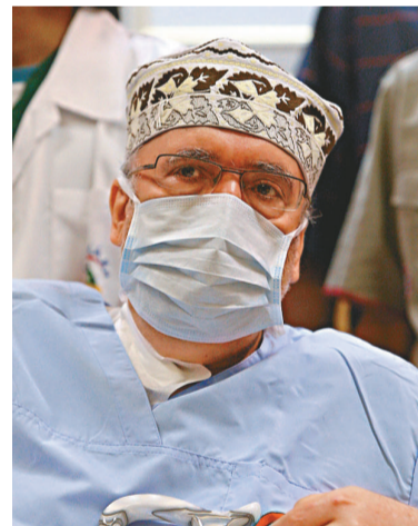
▲Abiraterone有效治療了洛克比空難主犯邁格拉希的癌症 資料圖片