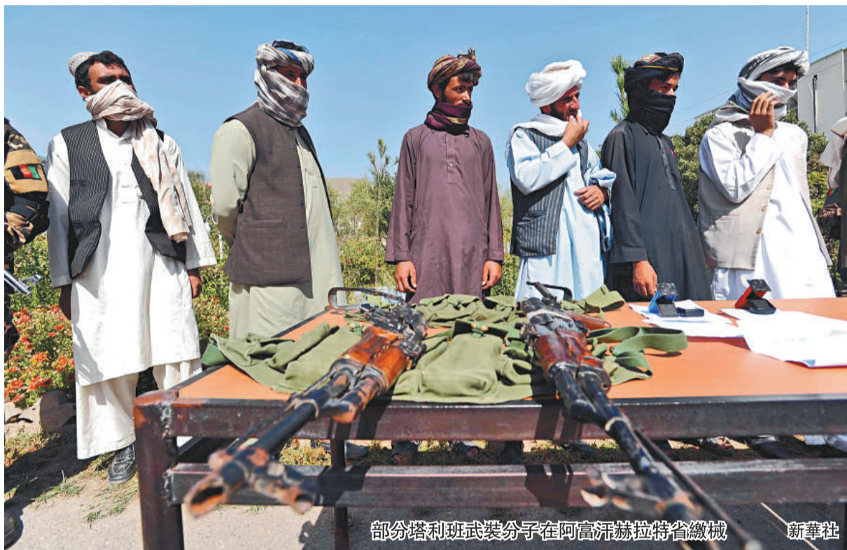
部分塔利班武裝分子在阿富汗赫拉特省繳械