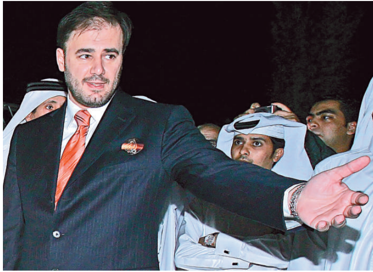
▲卡塔爾半島電視台台長瓦達漢法爾宣布辭職

【本報訊】據《紐約時報》、新華社21日報導：卡塔爾半島電視台的台長瓦達漢法爾宣布辭職。早前「維基解密」網站曾披露一份文件指，漢法爾與美國中央情報局有直接聯繫，並迫於美國壓力，對伊拉克戰爭的報導做出調整。此事觸怒了卡塔爾政府，卡塔爾元首下令撤查，漢法爾被迫提出辭職。原卡塔爾天然氣公司總裁艾哈邁德獲委任為半島電視台台長。