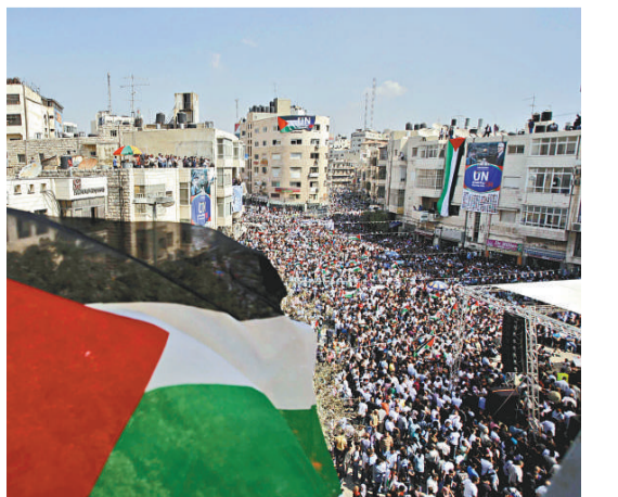
▲巴勒斯坦人21日在約旦河西岸為支持巴國申聯遊行造勢

【本報訊】據法新社、英國《衛報》21日報導：數以千計的巴勒斯坦人21日穿過約旦河西岸，為支持巴國申請加入聯合國舉行遊行造勢。與此同時，外交官們私下都在努力說服阿巴斯放棄巴勒斯坦申聯入聯的計劃。