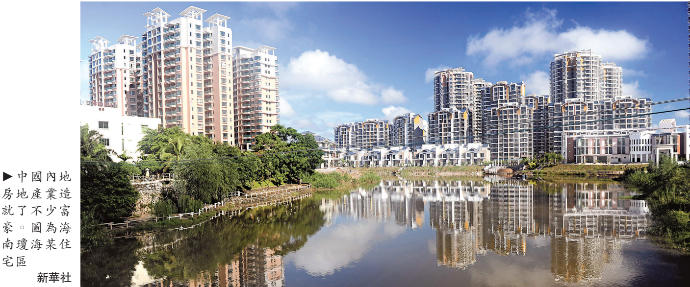
► 中國內地房地產業造就了不少富豪。圖為海南瓊海某住宅區