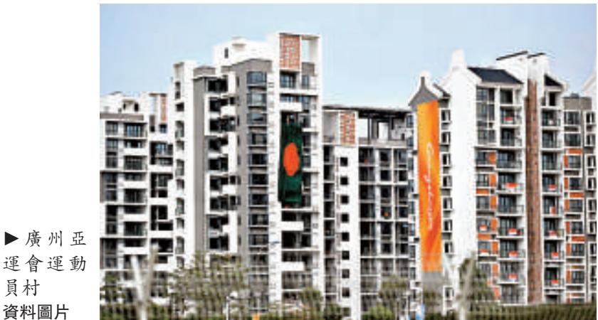
► 廣州亞運會運動員村 資料圖片