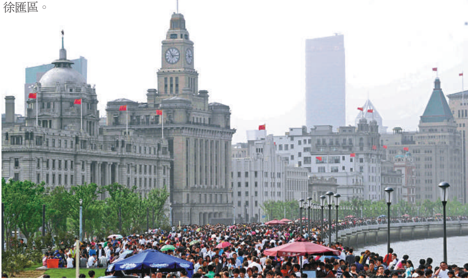
◀ 上海常住人口為 2301.92 萬人，10 年間增加了 661.15 萬人。圖為上海外灘 新華社

2010 年上海市中心的黃浦、盧灣、長寧、靜安、虹口 5 個區人口均比「五普」減少，其中下降幅度最大的是黃浦區，減少四分之一，郊區人口增幅最大的則是松江區。