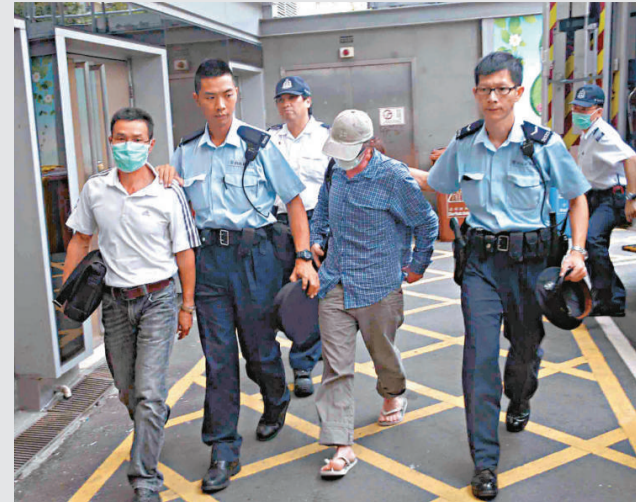
▲報稱受傷的裝修工人被送院