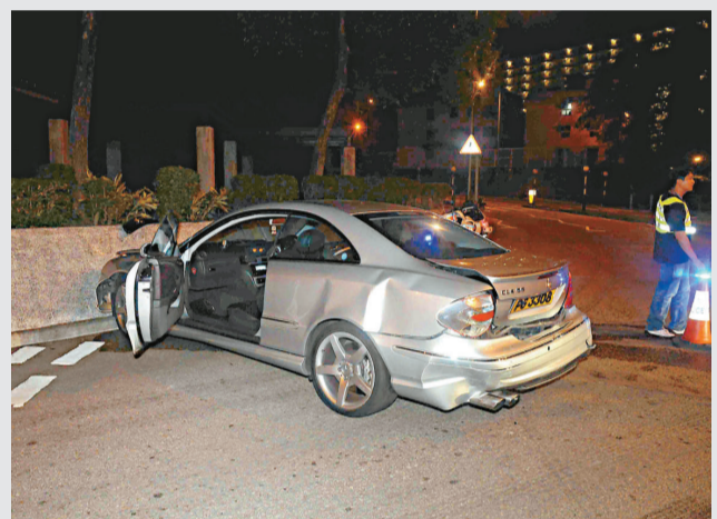
▲撞擊的銀色平治受損較嚴重

昨日下午一時許，六名工人在土瓜灣馬頭角道一間裝修公司內，為金錢問題發生激烈爭執，期間有人就地取材拿起木棍及鐵枝，向對方襲擊，對方兩人見狀恐受圍攻寡不敵眾取木棍還擊，六人大打出手混戰，警員接報持盾趕至將其制止，六名工人均報稱被打，由多輛救護車送院檢驗，稍後被捕帶署。