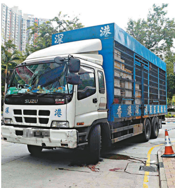
▲上水新成路運菜貨車輾斃老婦現場 ◀老婦被送院搶救後證實傷重死亡