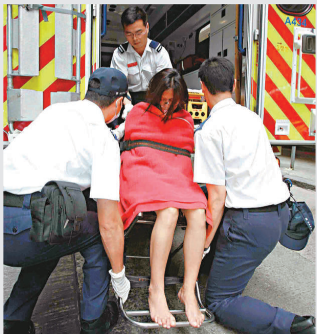
▲雙料自殺女子被送院

昨日凌晨一時許，一輛黑色平治跑車沿荃灣二坡坳路向九龍方向行駛，至老圍路交界時，前面一輛銀色平治因應交通情況收慢，「黑車」收掣不及，猛撞前車車尾，「銀車」司機突遭撞擊猛踏腳掣，詎料疑錯油門衝前五十多米後撞壘，兩車上三人受傷送院。