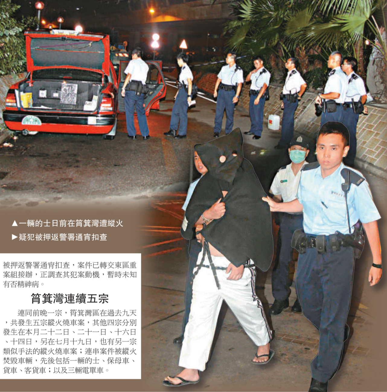
▲一輛的士日前在筲箕灣遭縱火 ▶疑犯被押返警署通宵扣查

柴灣特遣隊鑑於縱火狂昨晚燒車不停手，於是在東喜道附近埋伏守株待兔。皇天不負有心人，前晚深夜十一時四十五分，探員發現一名中年漢走近路邊電單車形迹可疑，立即金睛火眼監視，不久後男子突然點火燒車，冒出火焰濃煙，跟着拔足欲逃。探員見狀立即撲出，將疑人制服拘捕，同時上前把火撲熄，由於及時撲救，電單車只座位輕微燒毀。疑犯