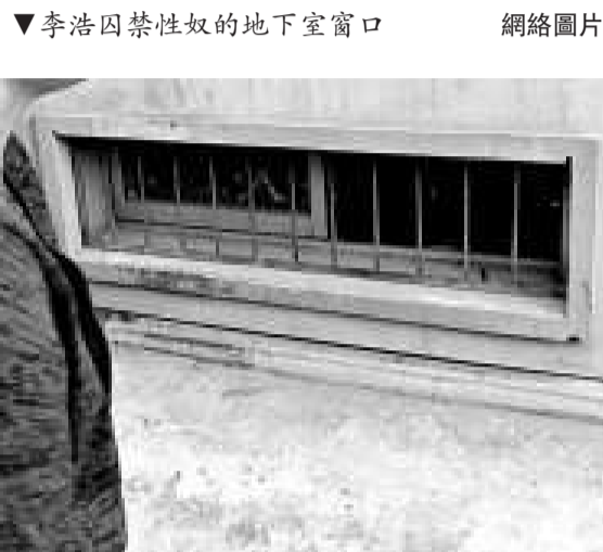
▼李浩囚禁性奴的地下室窗口 網絡圖片