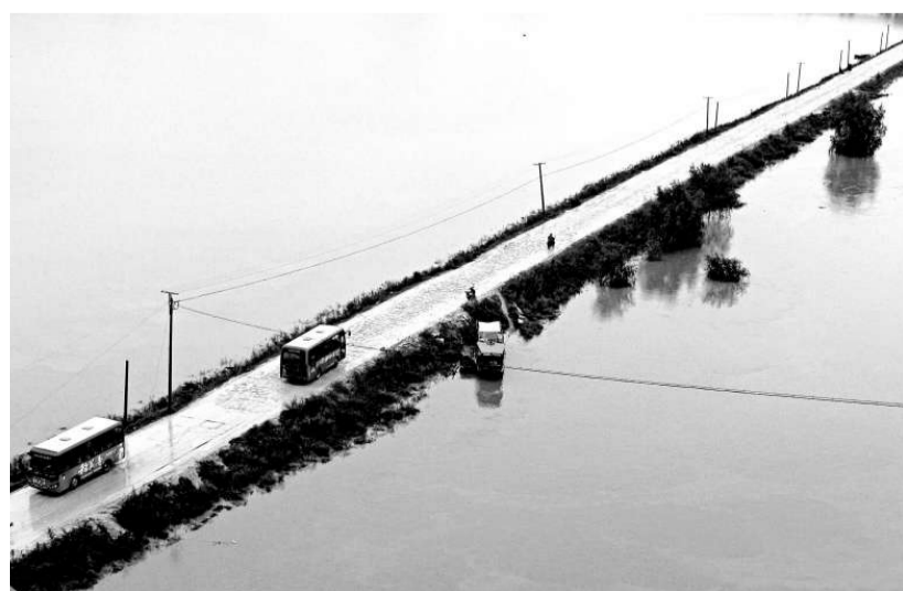
▲十四日拍攝的即將被漢江水淹沒的湖北省十堰市鄖縣三門大壩

【本報訊】中國本月發生的罕見秋汛基本結束，24日國家防總終止了防汛Ⅲ級應急響應。