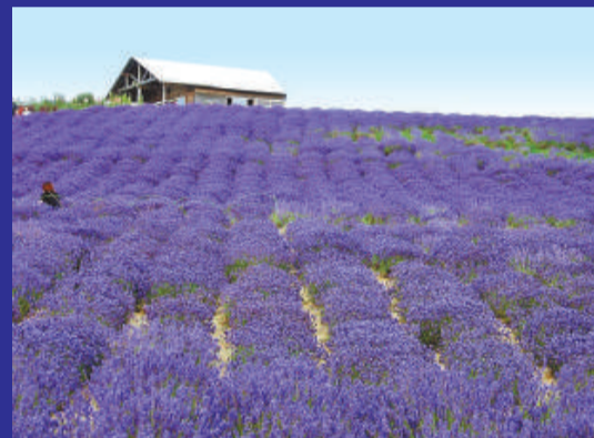
▲崇明紫海鷺圓浪漫莊園

有傳說稱，曾有一船載滿崇明米酒的小船傾覆，雖然船老大和水手都成功脫險，但滿船的米酒都傾倒在潘家沙的河道裡，熟料江水中的魚蝦自此也沾染上了酒香。