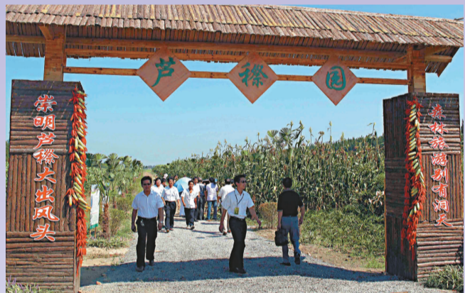
▲遊客參加「蘆葦節」可品嚐美味的蘆葦和柑桔