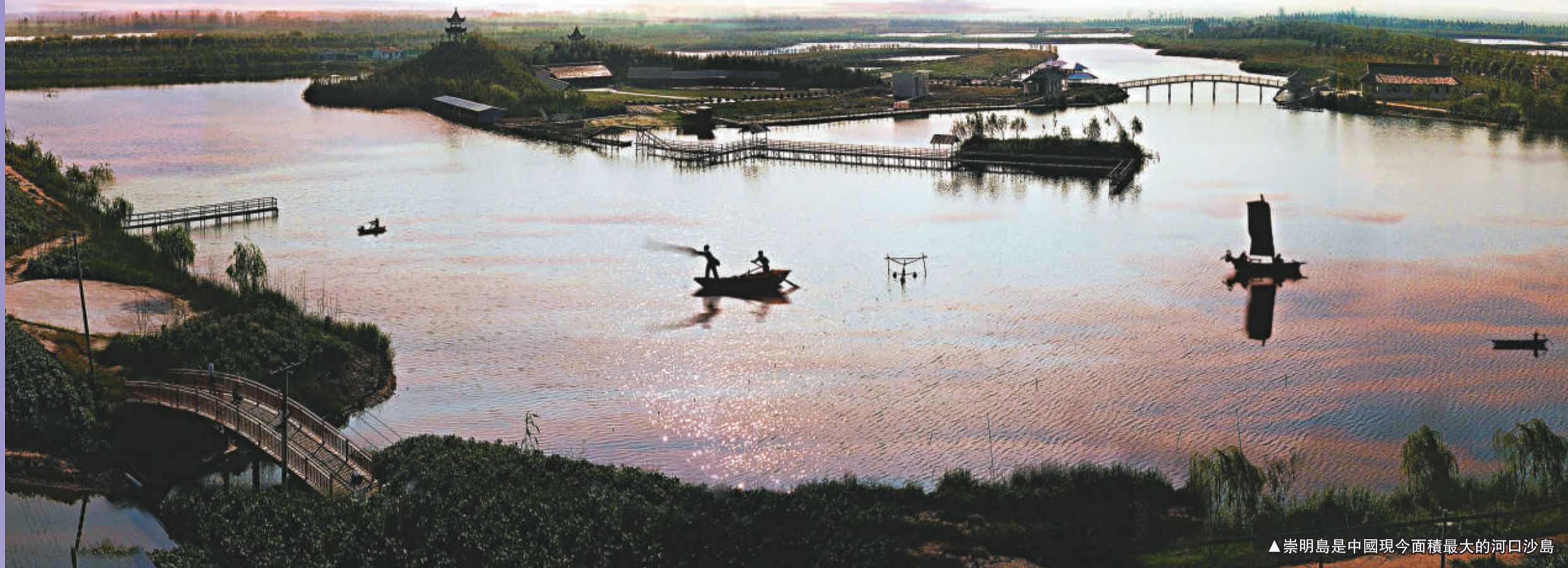
▲崇明島是中國現今面積最大的河口沙島

有「東海瀛洲」美譽的崇明島，位於上海北部長江入海口，據說崇明至今已有1300多年歷史。由於地處亞熱帶，平均氣溫攝氏15度，日照充足且雨水充沛，四面環江臨海的地理特點，以及豐富的灘塗資源使崇明成為上海地區最靠近大自然的地方。