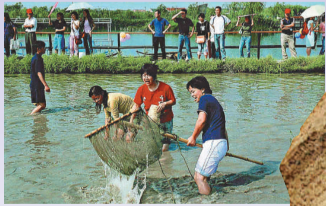
▲崇明旅遊節將舉行一系列漁家樂活動

作為上海旅遊節的重要組成部分，崇明森林旅遊節系列活動將持續至10月30日。從瀛東漁歌節、橫沙島秋之韻系列活動，到海島音樂節、森林音樂節，再到明珠湖海鮮節、蘆葦節、柑桔節、濕地文化節，一系列豐富的旅遊文化節慶活動，將給崇尚樂活(LOHAS, 英語 Lifestyles of Health and Sustainability的縮寫, 意為健康及自給自足型生活方式)的人, 帶來一場與自然零距離的親密接觸。