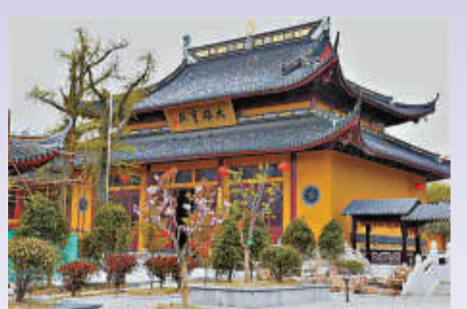
▲崇明金鑿山「壽安寺」已有逾千年歷史