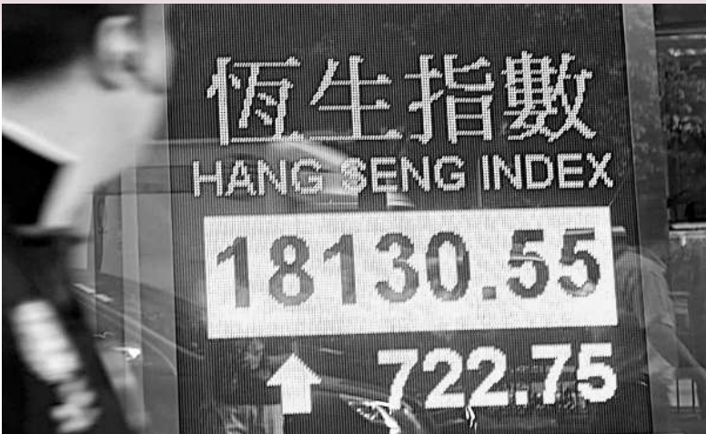
▲中資金融股昨成升市火車頭，刺激恒指尾市重上18000點關口，收市抽高722點，報18130點