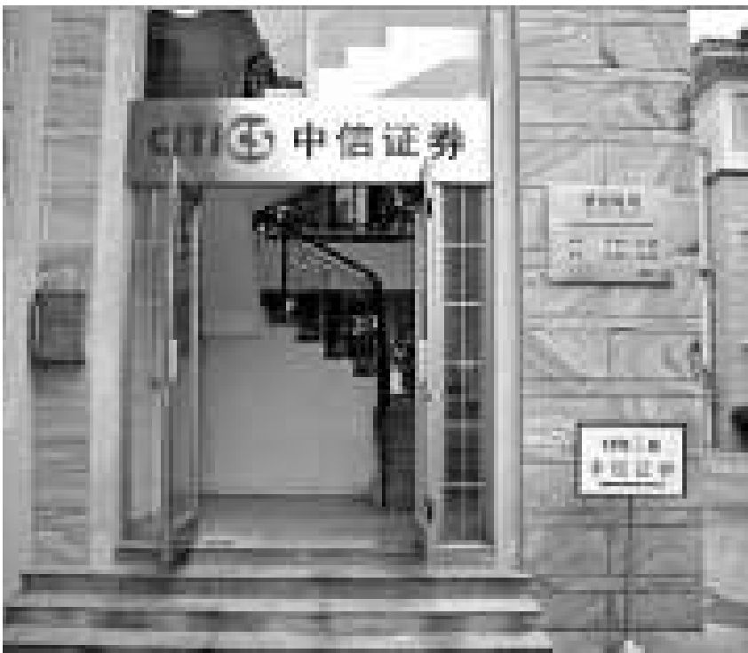
▲中信證券昨日公開發售截止，雖未足額，但國際配售獲4倍認購

公司預計今明兩年資本開支分別為1800及6500萬元，主要用於購買額外生產設施及建設工廠，預計今年度派息比率約30%。