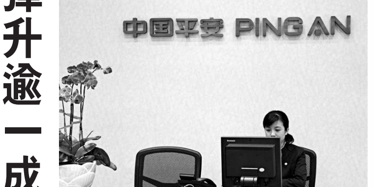
▲平保股價昨日戲劇性反彈，全日急升逾一成至46.8元

對於平保股價大幅波動，野村證券發表研究報告指，股價反映市場對平保業務前景理解度不足，又認為平保管理層需時向市場證明，將金融業務綜合化遠比單作保險營運商有利，並指對平保業務表現具信心，料其繼續為業內最佳保險業務之一。該行預期，今年下半年壽險行業難有大反彈，或要待明年才有起色，惟相信平保於市場仍處有利位置。該行維持平保「買入」評級，及97元之目標價。