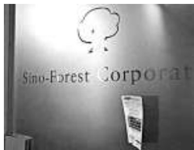
▲綠森集團昨天復牌，股價大幅下挫，一度跌至最低0.46元，最終收報0.59元，下跌逾33%

上月底遭證監會勒令停牌的綠森集團（00094）昨天復牌，受早前母公司嘉漢被降級消息拖累，復牌後股價大幅下挫，一度跌至最低0.46元，最終收報0.59元，下跌逾33%。該公司前晚發通告，解釋旗下南美洲蘇利南