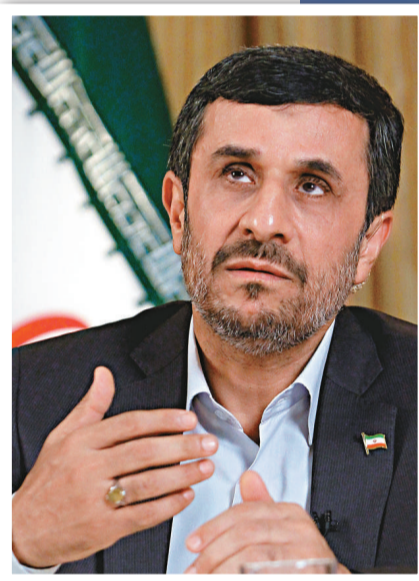
▲伊朗總統艾哈邁迪內賈德

美國和其他西方國家指責伊朗以民用核電建設為名目，尋求獲取核武器能力。但伊朗強烈否認。伊朗現時因其核計劃受到聯合國安理會以及美國的多項制裁。