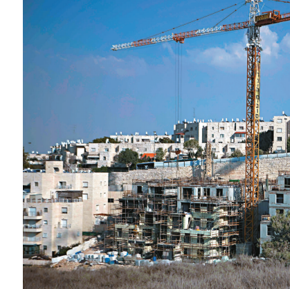
▲以色列在東耶路撒冷興建猶太人住宅

以色列在 1967 年中東戰爭中吞併了約旦河西岸、加沙地帶和東耶路撒冷，此後不斷在所佔領土地上修建猶太人定居點。如今大約 50 萬猶太人生活在這些定居點中。