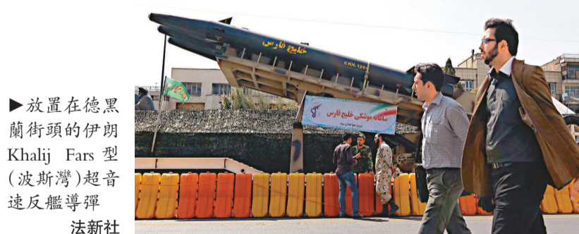
▶放置在德黑蘭街頭的伊朗 Khalij Fars 型(波斯灣)超音速反艦導彈

伊朗伊斯蘭共和國海軍司令薩亞利 27 日表示，伊朗海軍未來計劃駐紮大西洋。他表示，伊朗海軍將針對一些大國在伊朗海域附近駐紮的情況，在美國邊境水域駐紮。