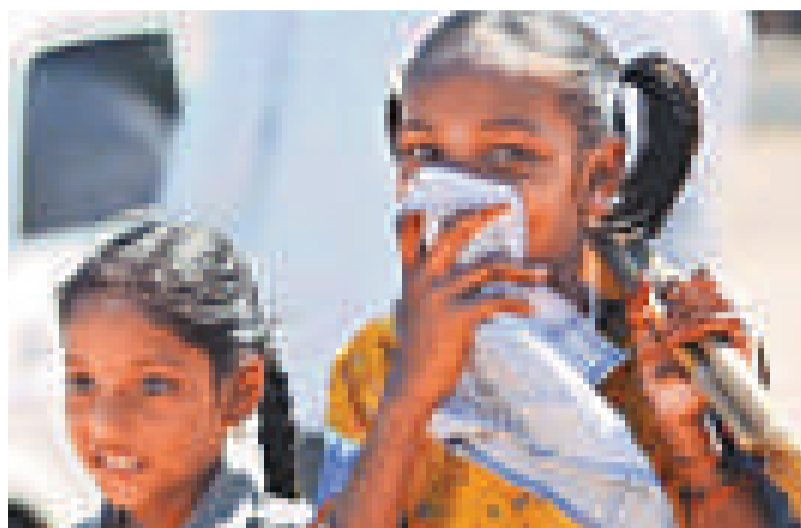
▲印度是個重男輕女的國家，過去20年，有數千萬個女胎被打掉，導致今日男女失衡問題嚴重

男女失衡問題早在數十年前已出現，情況最惡劣的不得不提印度。2001年，印度前首都德里男女出生比例為1000：886，時至今日更降至1000：866。今年2月，印度展開自1872年以來的第15次人口普查。結果顯示，印度男女人口比例強烈失調，男性比女性多3720萬人；7歲以下的男女比例是1000：915，兩者人口相差710萬人，比2001年統計的600萬人，及1991年的420萬人更嚴重。要查找印度男女失衡的問題，並不是無法可追。印度本身就是個重男輕女的國家，婦女每當被驗出懷的是女嬰，就會狠心將胎兒打掉。過去20年，印度有數千萬個女胎被人為打掉。《印度斯坦時報》報道，由於父母不想承擔女孩將來的巨大婚禮費用和嫁妝，因此，每年有數百對父母願意花2000英鎊（約2.55萬港元）讓1至5歲的女孩被迫接受變性手術。更甚的是，印度女嬰地位卑微，父母會將她們成為流浪貓的食糧。