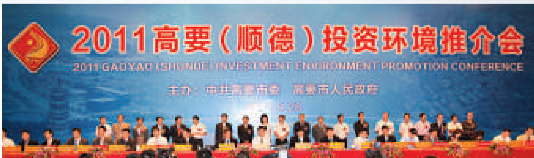
▲高要（順德）投資環境推介會共簽約、動工、投產項目20個，投資額68億多元 ▲肇慶市委書記徐萍華（前左二），佛山市委常委、順德區區委書記梁維東（前左一），高要市委書記范汝雄（前左三）、市長梁靖（前左四）出席推介會