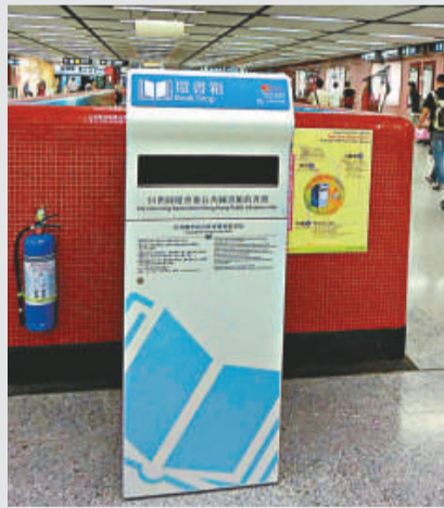
▶位於港鐵中環站的還書箱

康文署發言人稱，康文署已僱用承辦商運送書籍，每天三次到三個港鐵站收回歸還的書籍。承辦商會盡快將歸還的書籍送到處理中心辦理歸還手續，更新讀者的借閱紀錄，以及將書籍送回所屬圖書館。讀者只要是在書籍到期日或之前把書籍放入還書箱，便不會被視作逾期還書。