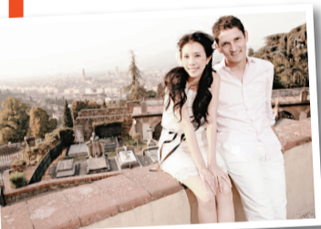
▲莫文蔚(左)表示佛羅倫薩對她和未婚夫有特別意義