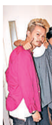
▲栢芝(右一)的新公司低調開張,贈現金予員工