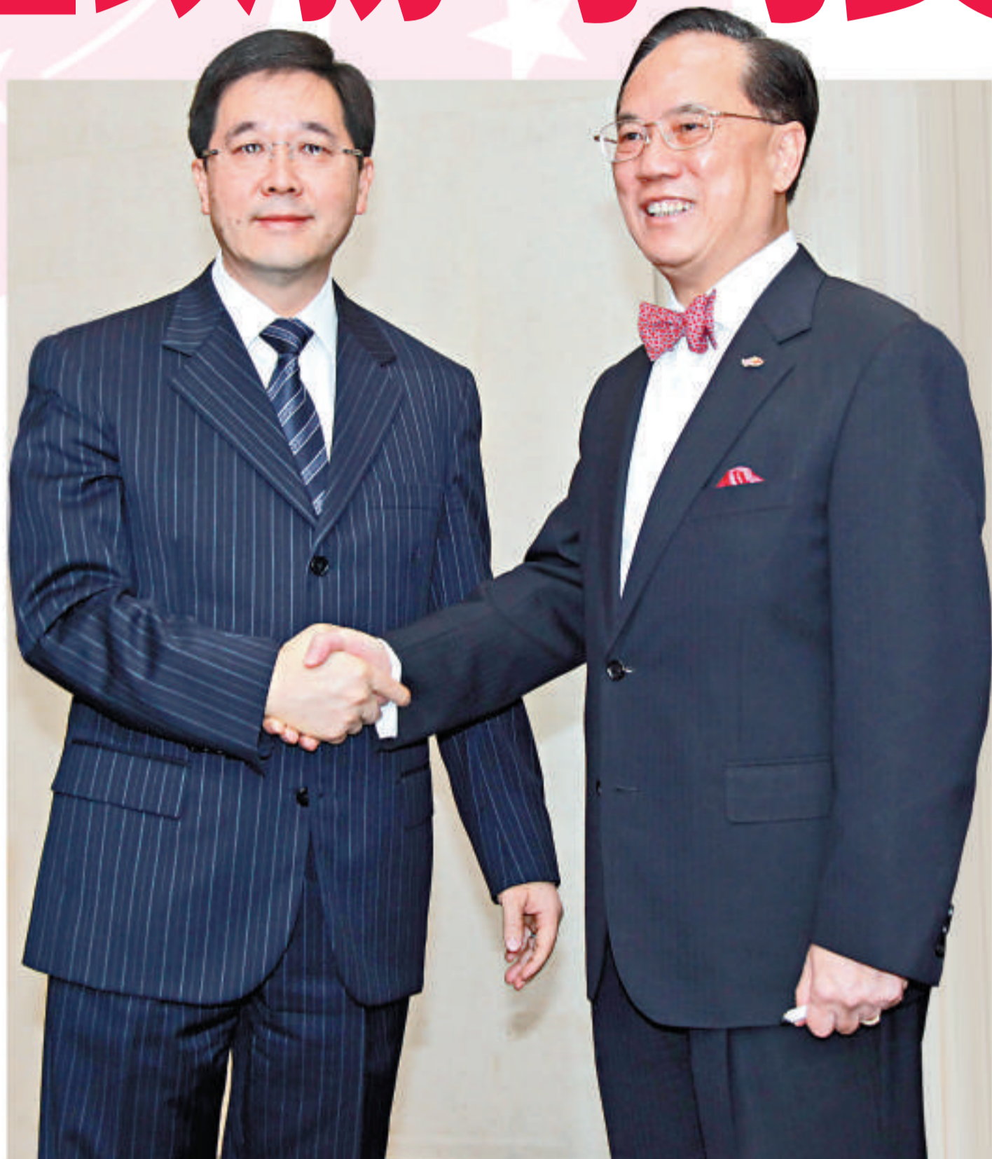
▲曾蔭權(右)與新任政務司司長林瑞麟握手合照