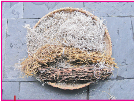
● 製造宣紙的檀皮、沙田稻草等

隨著當今時代的不斷進步發展和社會文明進程的不斷提高，各種高、中檔的宣紙及紀念宣紙暢銷海內外，在深受廣大書畫家喜愛的同時，還因具有極高的收藏價值，而備受消費者和收藏者的青睞。目前因為原料、勞力成本比較高以及宣紙的收藏熱等因素，導致「紅星」牌宣紙價格不斷上漲，且一直處於供不應求的狀態。現在市場上多見一些小廠、作坊生產的書畫紙張，一般只適宜於作繪畫練習或書法用。小廠和作坊生產宣紙時出於成本的考慮少加或不加入檀樹皮和沙田稻草；但有的廠家也能生