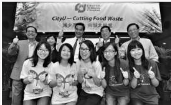
▲師生員工一致響應「減少廚餘，由城大做起」，為環保出一分力、履行城大社會責任

香港城市大學正推行一項全校性活動，鼓勵用膳的師生員工努力減少廚餘，並將廚餘加工製成魚糧，攜手營造綠色校園，以履行城大承諾的社會責任。