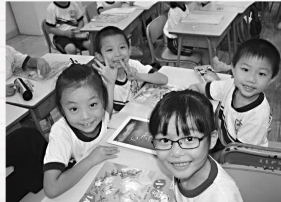
▲數學課上用iPad 2學習，學生既興奮又雀躍

學校的廚餘大使每天會收集廚餘，把數據記錄下來，選把廚餘製成肥料供全校植物使用。憑着學校師生的努力，於本年度更榮獲第九屆香港綠色學校大獎，學校成果有目共睹。