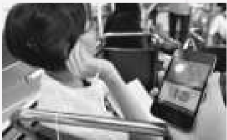
▲港大推出「香港軌跡」的免費流動App，讓市民可一邊乘坐電車，一邊使用應用程式自導遊，體驗香港面貌百年來的變遷

同時，「香港軌跡」充分反映港大百周年校慶的主旨——知識、傳承、服務。教授以其專業知識開發應用程式，讓市民多認識本土歷史文化；集合社區故事，讓公眾從不同角度接觸港大和社區發展；除開發免費應用程式，稍後亦會利用「港大100」電車作為流動教室，舉辦不同主題的導賞遊。