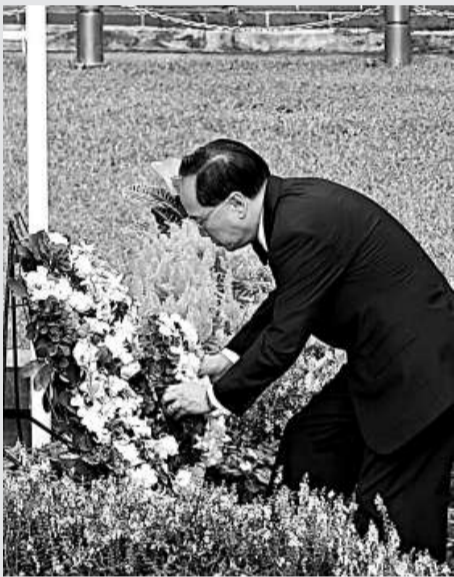
▲曾蔭權在紀念儀式上獻花

上海的陳先生及干小姐原打算花一萬多元購物，但發現價錢便宜，最終超支兩萬元。兩人均首次來港，覺得本港環境好，人多但街道清潔，交通配套良好，鬧區塞車情況並不嚴重，但他們認為行人指示牌數量不足，而且在飛機場、各車站的服務人員態度並不好。陳先生說：「特別是在機場，服務人員的國語水平並不好，向他們查詢時，時常聽不明白服務人員的解答，更有服務人員會假裝聽不到，轉身離開。」他表示，用英語與香港人溝通竟比國語有效，令他意想不到。