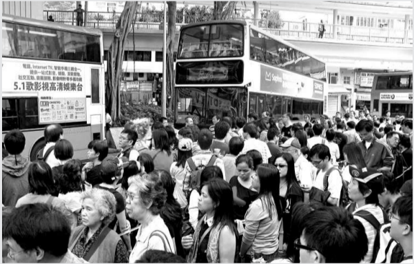
▲香港市民在重陽節拜祭先人，墳場附近車站擠滿手持鮮花祭品的孝子賢孫 中通社

原東江縱隊港九獨立大隊成員，現年八十五歲的張伯伯，四二年開始加入東江縱隊，後轉任游擊隊隊員，參與抗日游擊活動逾四年。他憶述當年在游擊隊的經歷，仍感覺到很興奮，但由於時隔已久，對於具體事件的印象已模糊。雖現已移居到山東居住，但每逢重陽節日，張伯伯總會回港出席紀念活動，向當年的戰友及烈士致敬。