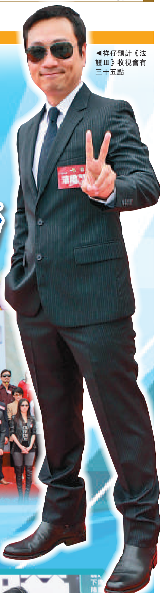
◀祥仔預計《法證III》收視會有三十五點